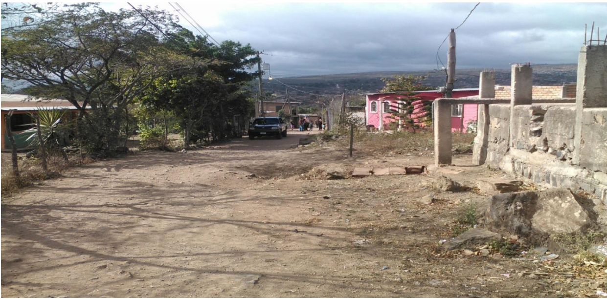
Foto no 4 Colonia Brisas del Mogote