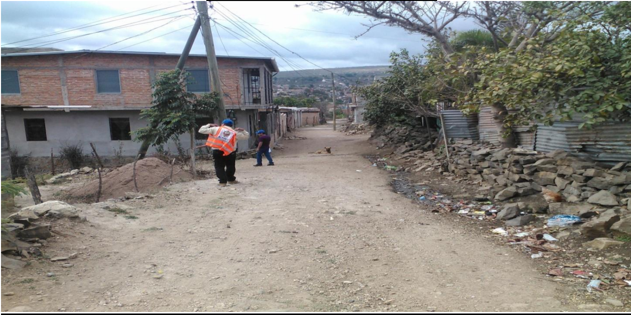
FOTO No 3 COL. Brisas del Mogote Vista de la Calle a Conformar y Balastar