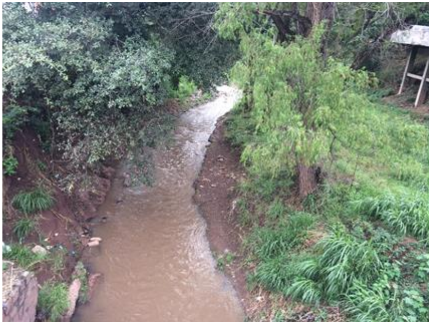
VISTA DEL TRAMO, LOCALIZADO EN COL. LA REFORMA