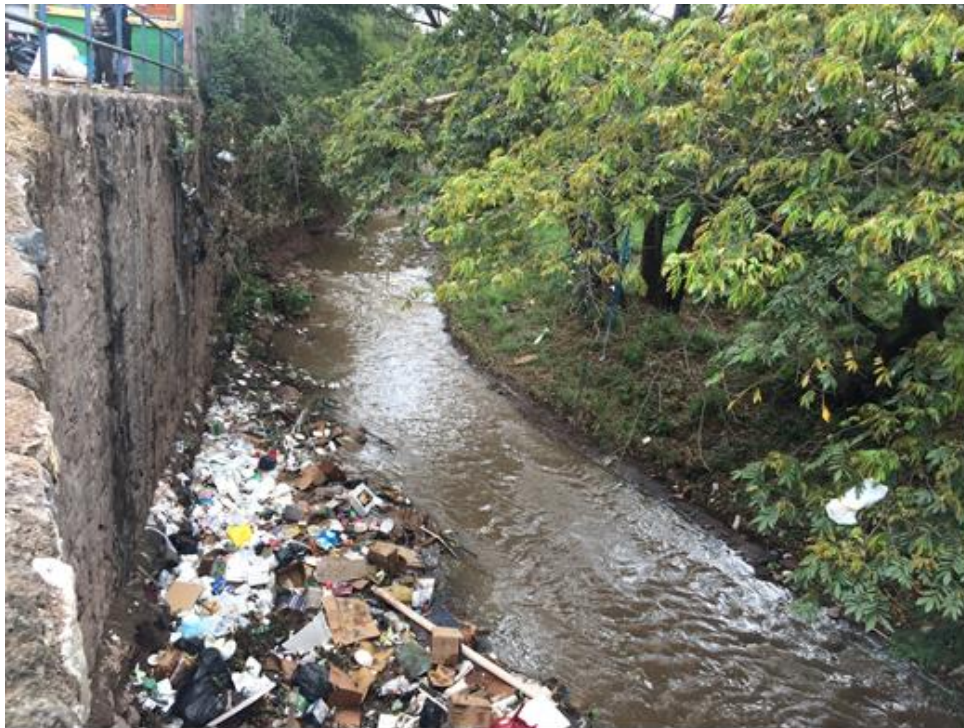
VISTA DEL TRAMO, LOCALIZADO EN BARRIO GUANACASTE