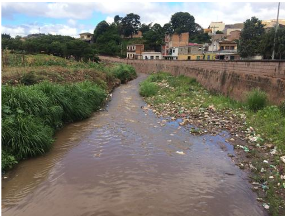
VISTA DEL TRAMO, LOCALIZADO EN BARRIO LA ISLA