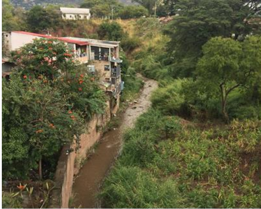
VISTA DEL TRAMO A CANALIZAR, COL. FRATERNIDAD