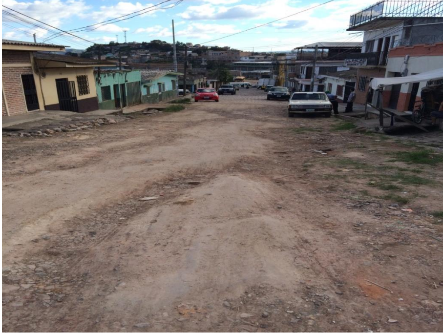
Vista panorámica de Tramo B