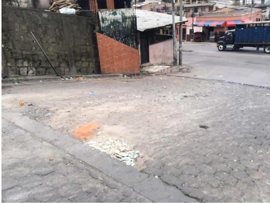
Vista del Tramo D