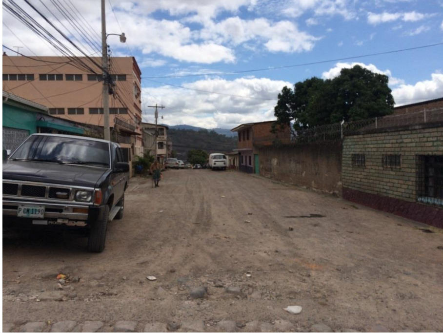
Panorámica del Tramo C