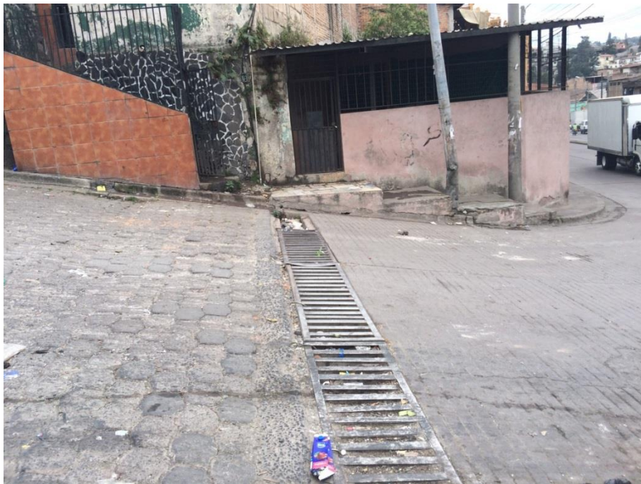
Inicio del Tramo D