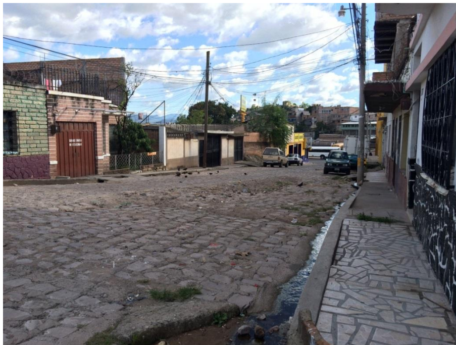
Vista de empedrado a reparar en Tramo A