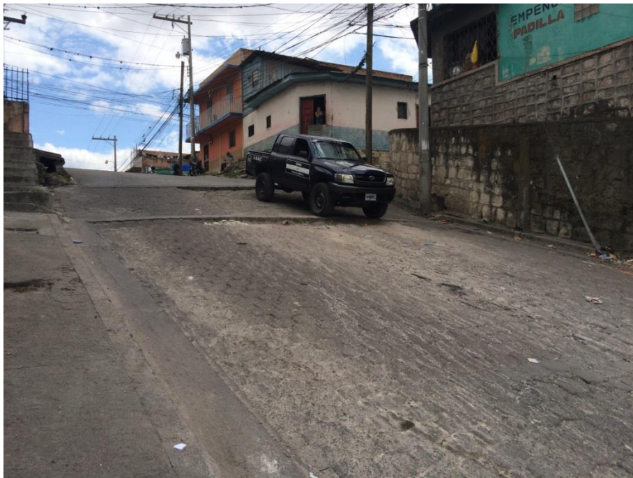
Final del Tramo D