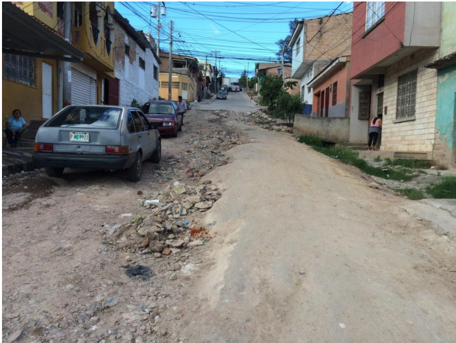
Vista del final del Tramo B