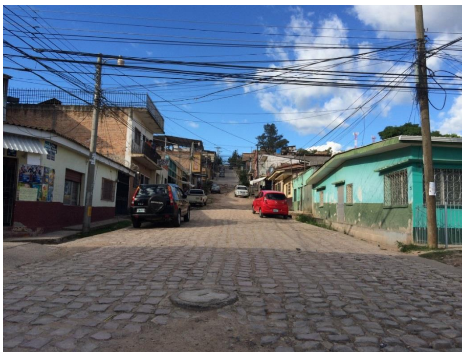
Vista panorámica de Tramo A