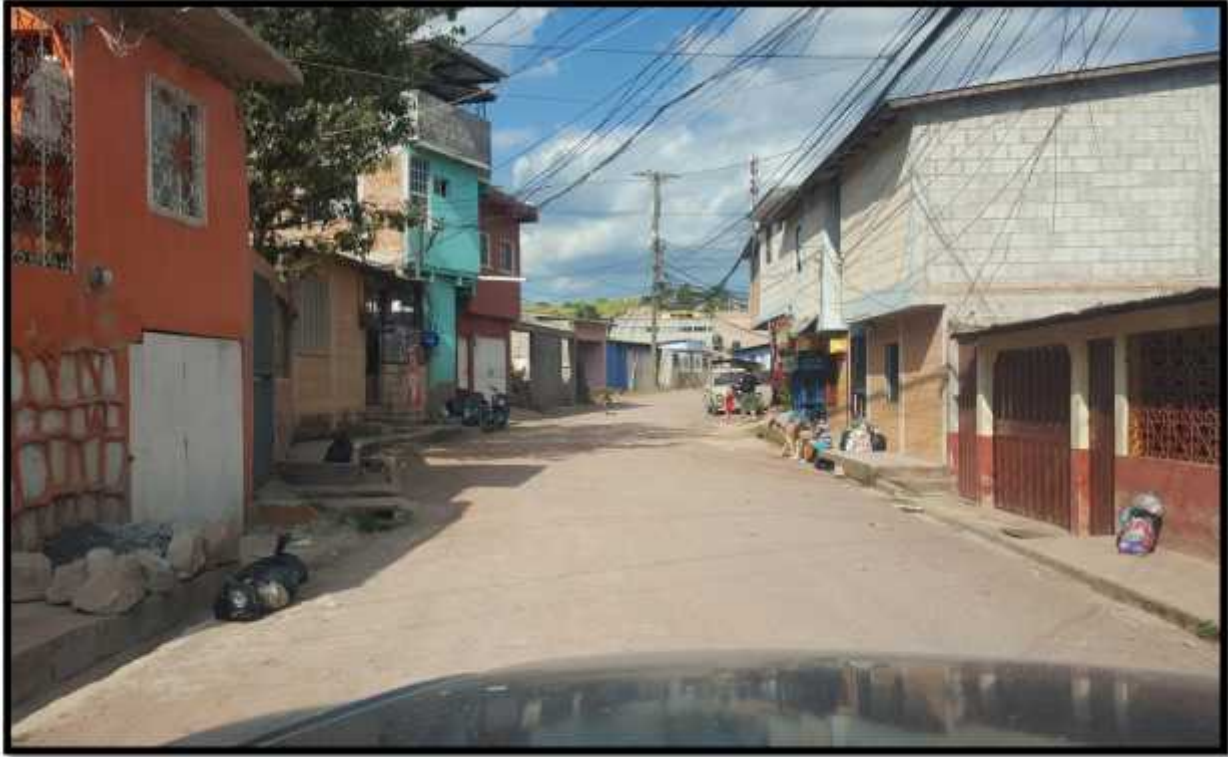
VISTA PANORAMICA DE LA CALLE A REHABILITAR