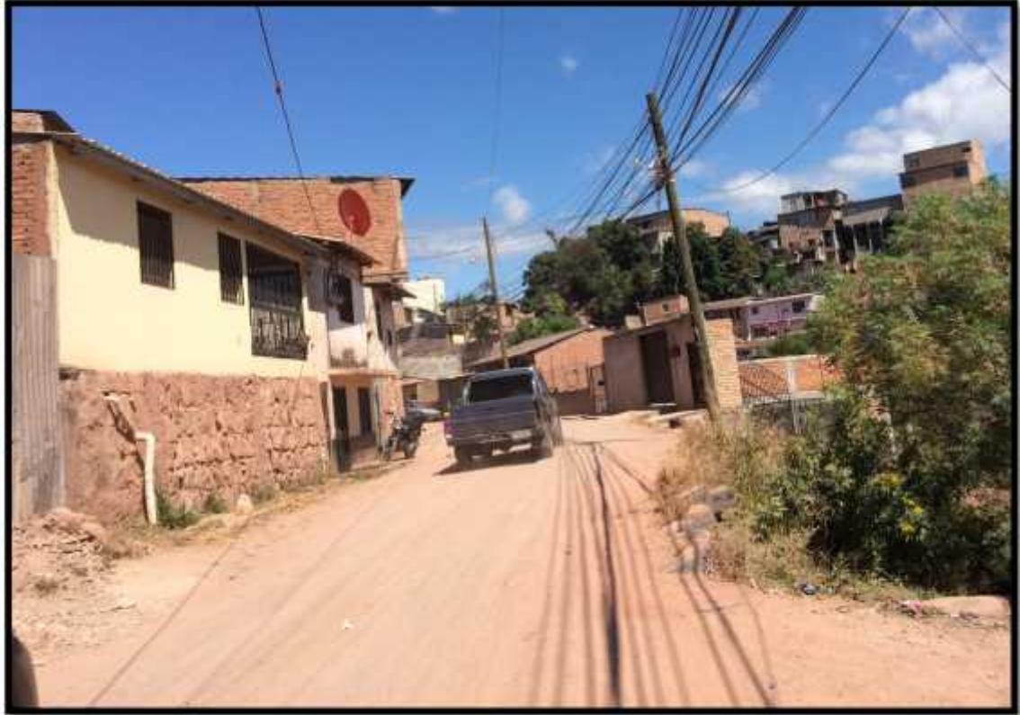
VISTA DEL FINAL DEL TRAMO