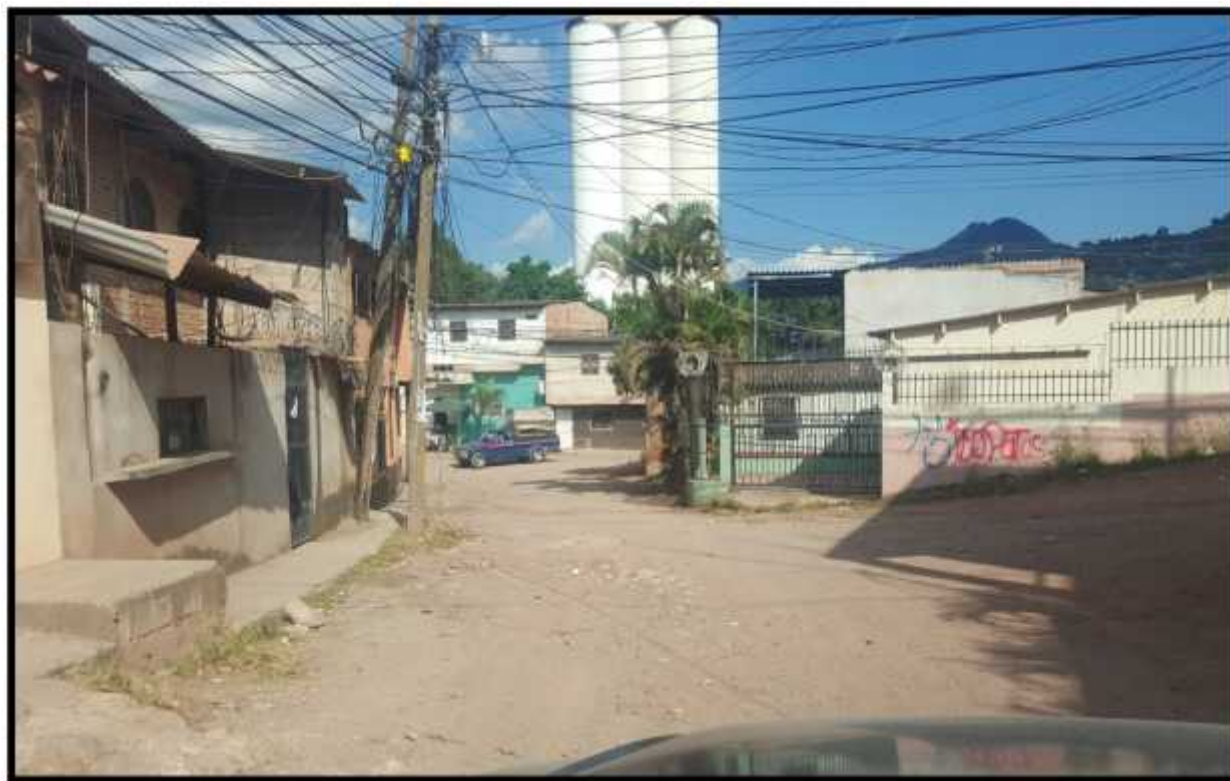
VISTA DEL INICIO DEL TRAMO A PAVIMENTAR