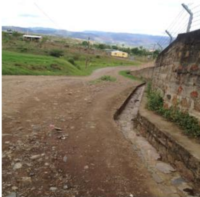
FINAL DE CALLE A PAVIMENTAR CON CONCRETO HIDRÁULICO