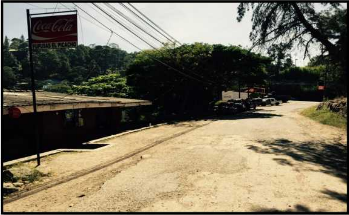
VISTA DEL INICIO DEL TRAMO A REPARAR