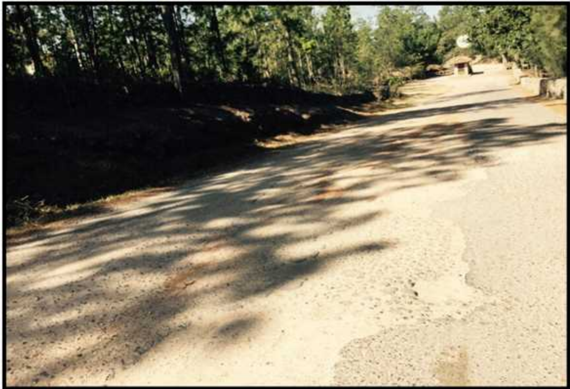
VISTA PANORAMICA DEL TRAMO A REPARAR