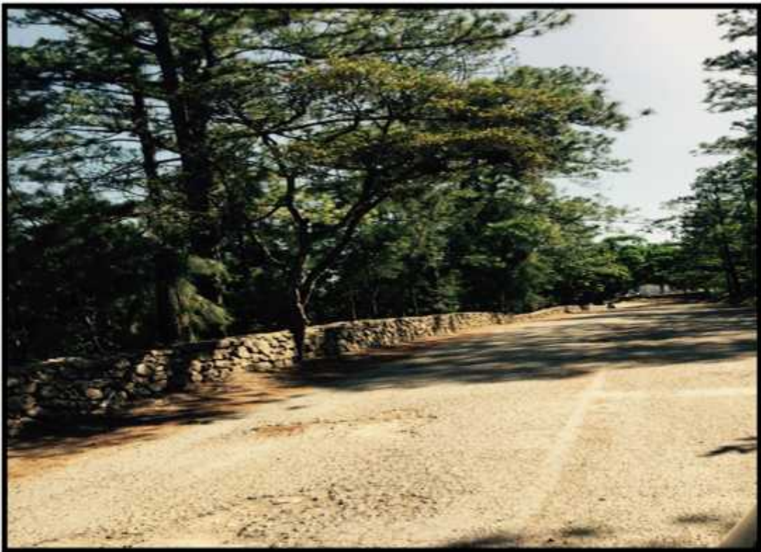
VISTA DEL FINAL DEL TRAMO, EN LA ENTRADA AL PARQUE