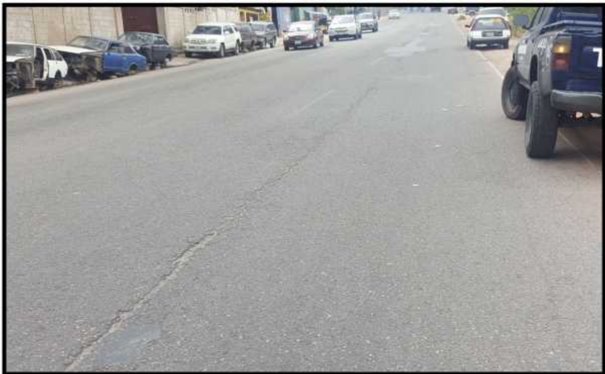
TRAMO CON GRIETAS EN LA CARPETA