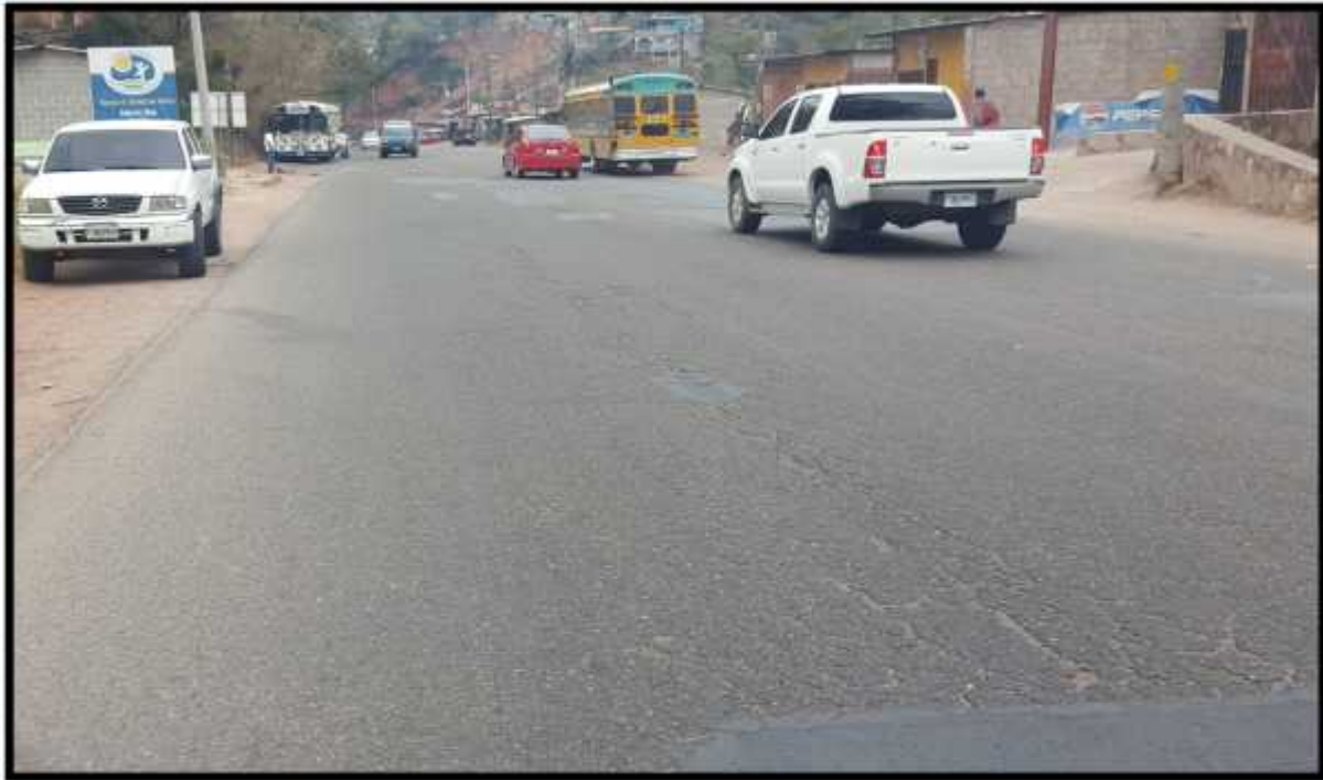
TRAMO EN MAL ESTADO A LA ALTURA DE COL. VILLANUEVA