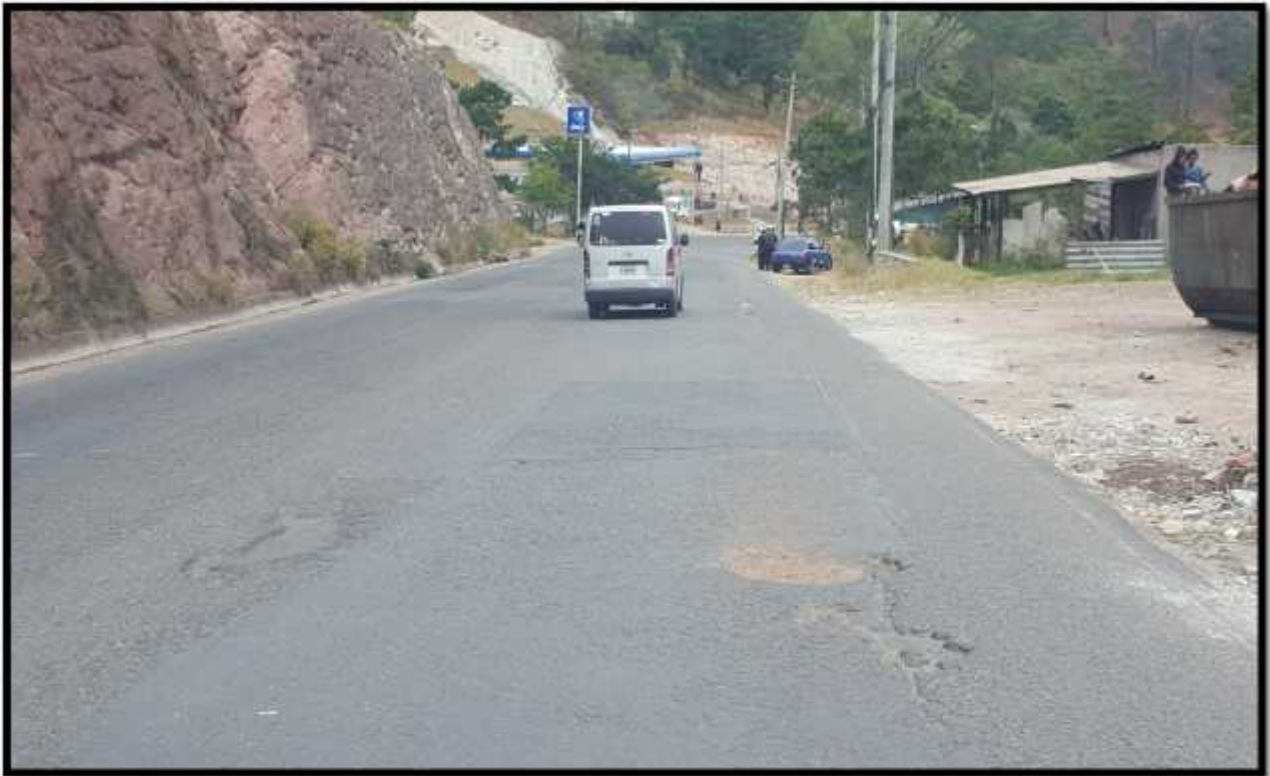
TRAMO A REPARAR A LA ALTURA DE LA GASOLINERA UNO