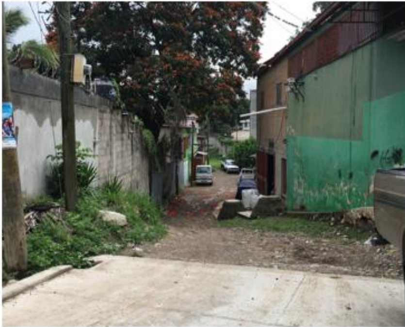
PANORÁMA DE CALLE A PAVIMENTAR CON CONCRETO HIDRÁULICO

Proyecto: Pavimentación de calle con concreto hidráulico, col. San Luis, tercera entrada Código: 1430