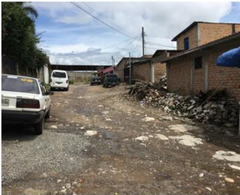
FINAL DE CALLE A PAVIMENTAR CON CONCRETO HIDRÁULICO