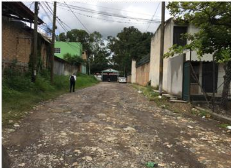
PANORÁMA DE CALLE A PAVIMENTAR CON CONCRETO HIDRÁULICO