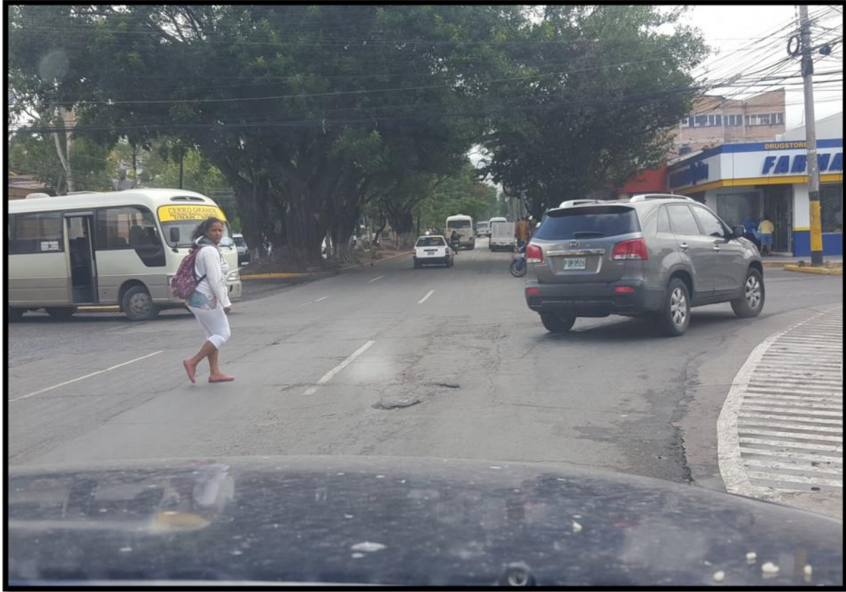
BACHES EXISTENTES EN EL BULEVAR PROCERES