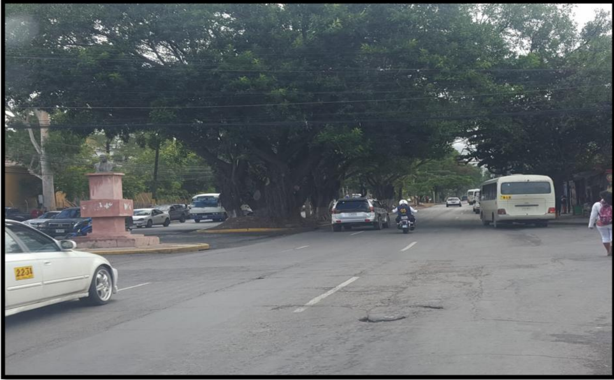
VISTA DEL TRAMO EN MAL ESTADO