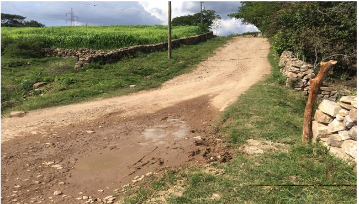
VISTA DEL MAL ESTADO DE LAS CALLES QUE REQUIEREN BALASTADO