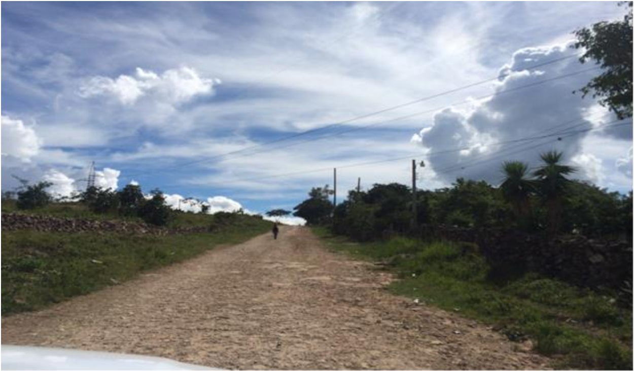
VISTA PANORAMICA DE CALLE A REPARAR