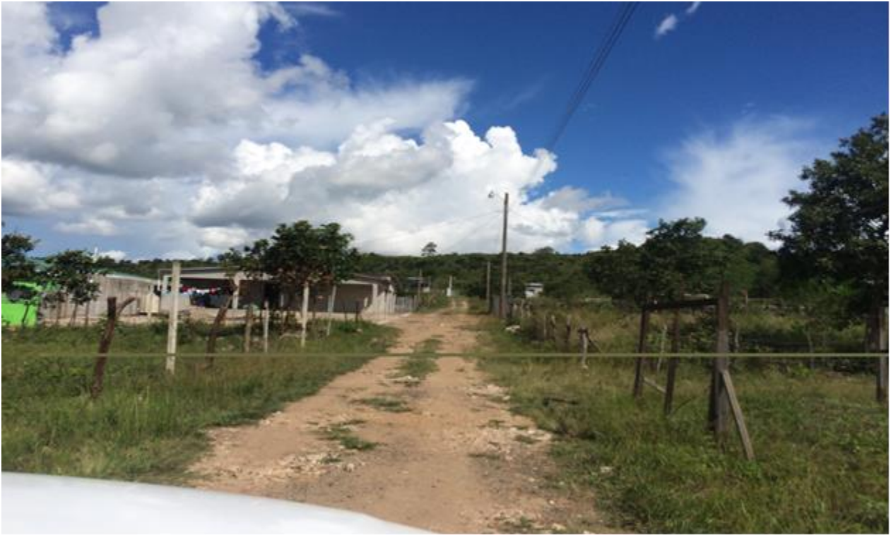
VISTA DE UNA DE LAS CALLES A CONFORMAR