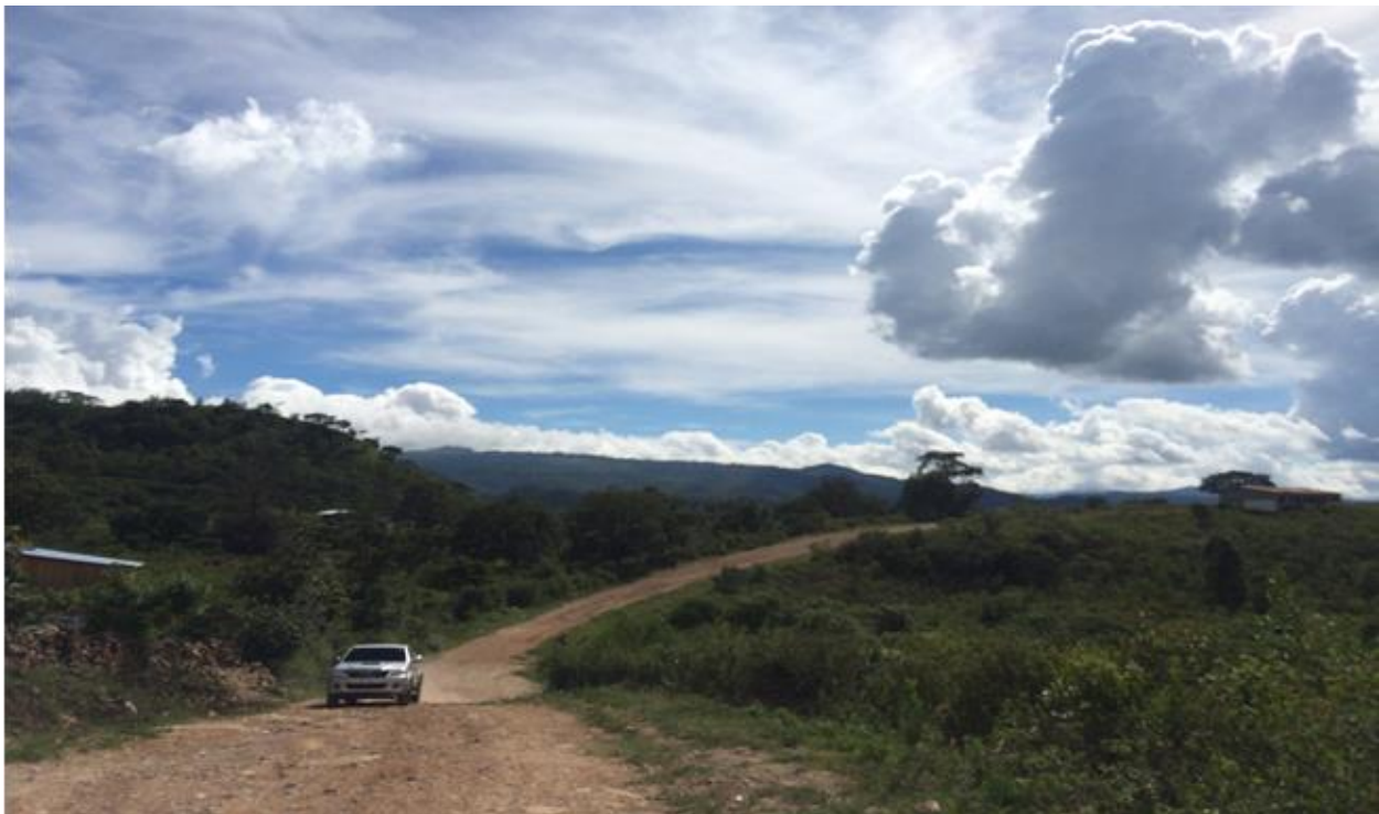
VISTA DE CALLE QUE REQUIERE BALASTADO