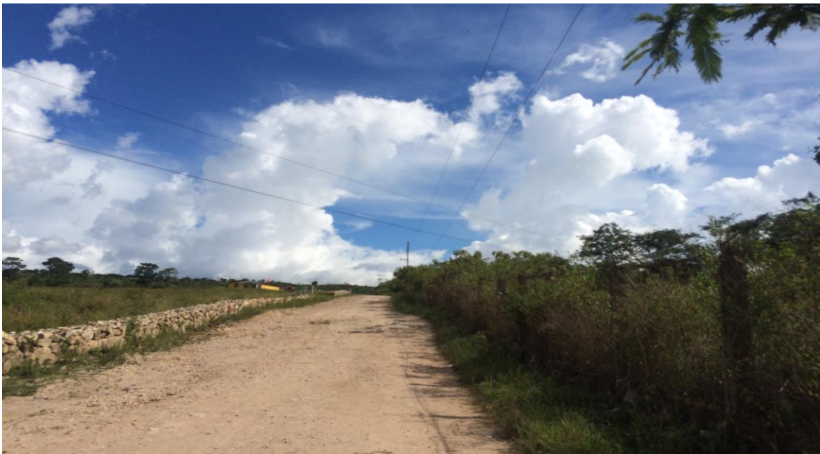
VISTA ACTUAL DE CALLE A REPARAR