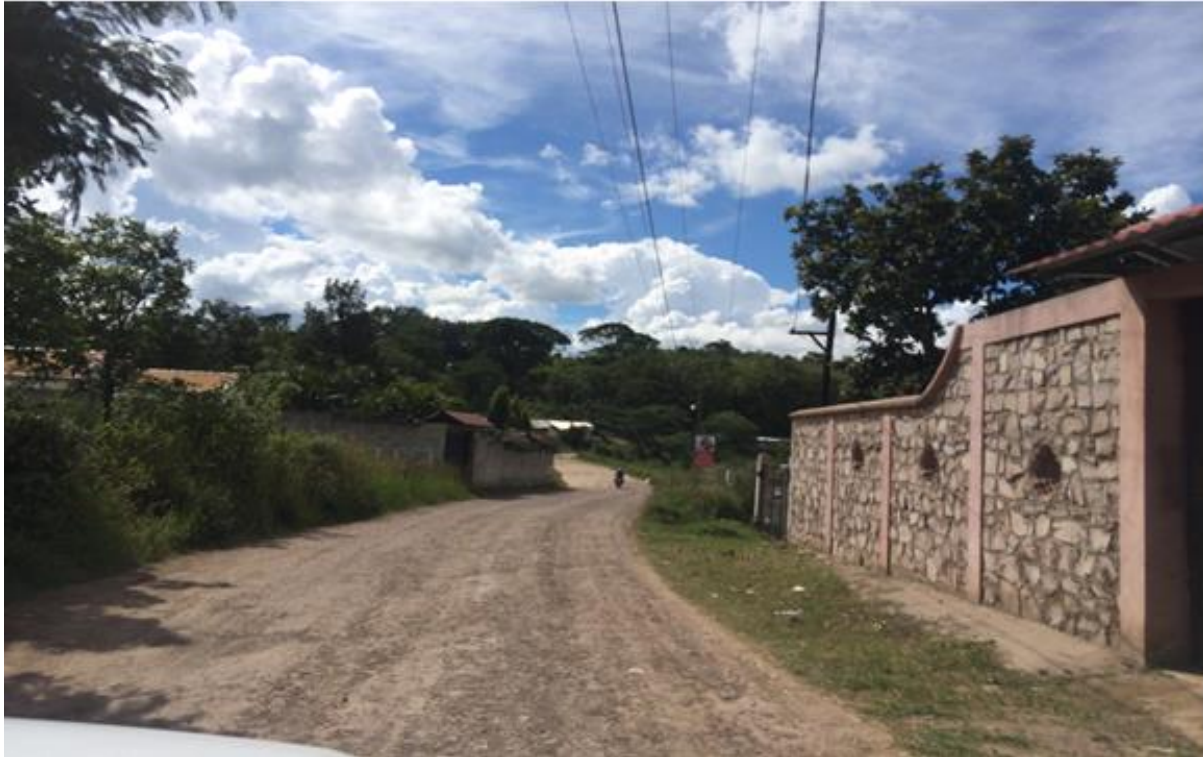
VISTA PANORAMICA DE CALLE A REPARAR