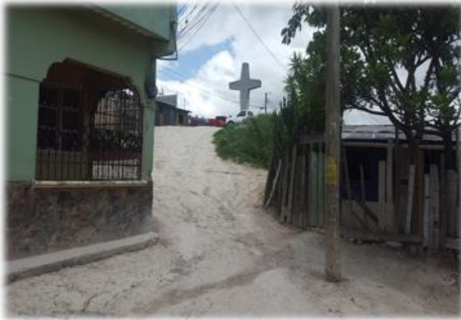
PANORÁMA DE CALLE EN LA QUE SE HARÁ EL BALASTADO

Proyecto: Conformación y balastado de calles, col. Altos de La Cruz y col. Nueva Suyapa Código: 1387