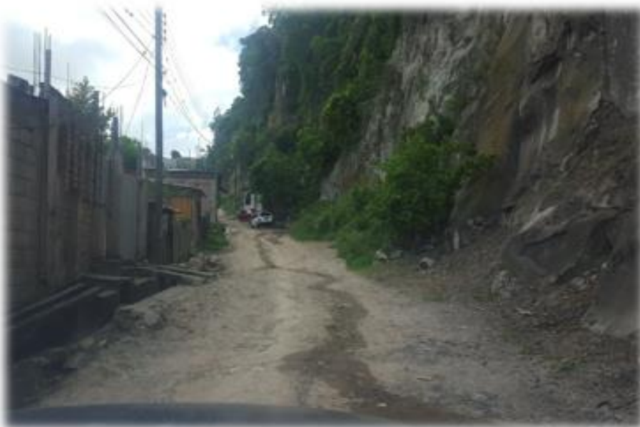
PANORÁMA DE CALLE EN LA QUE SE HARÁ EL BALASTADO