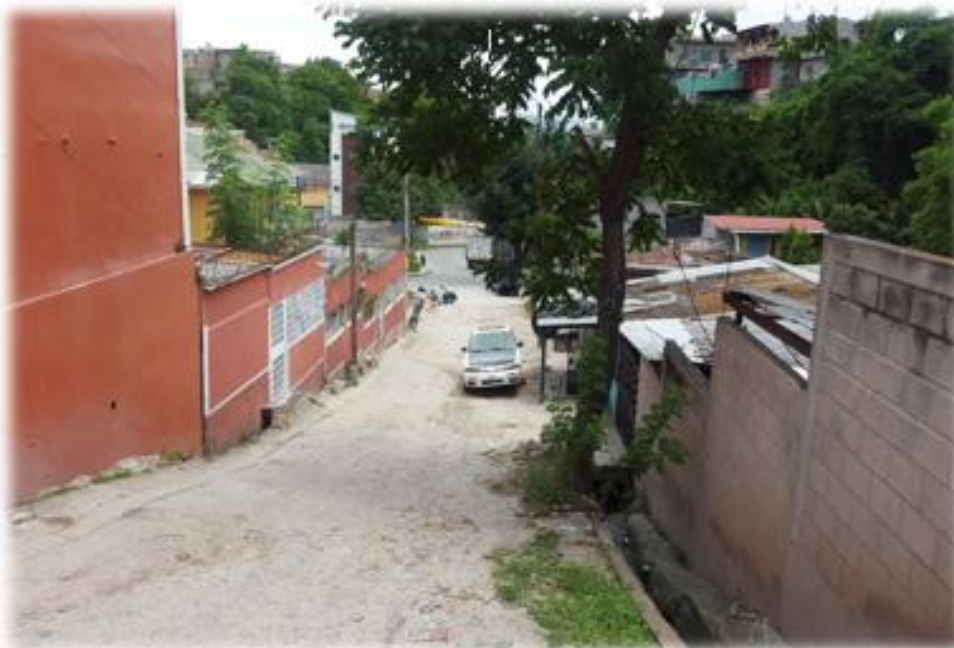
FINAL DE CALLE EN LA QUE SE HARÁ EL BALASTADO