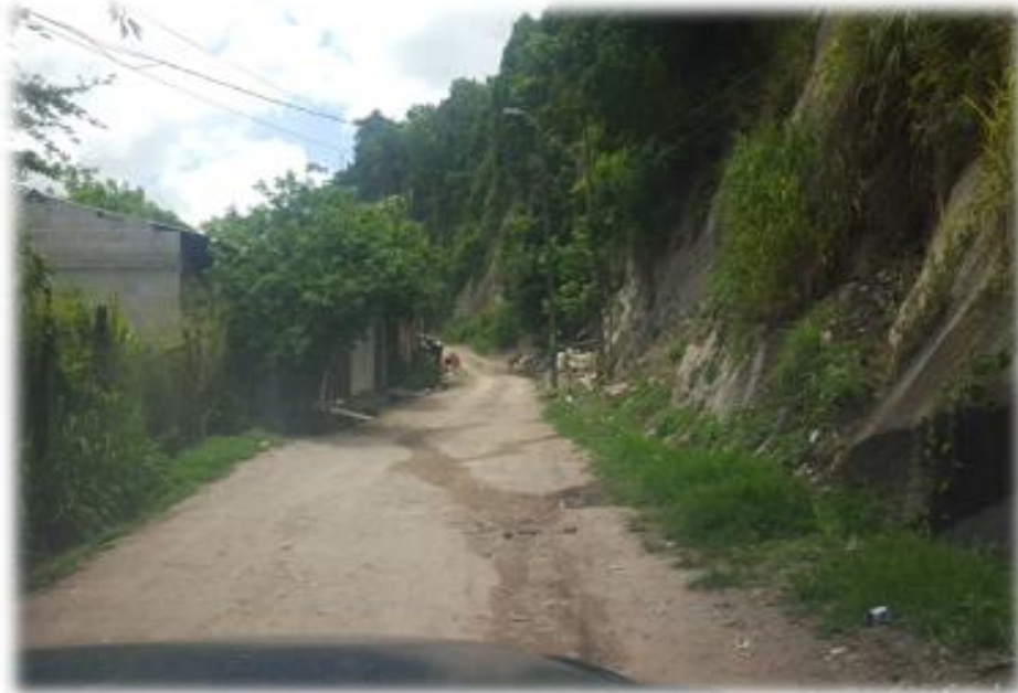
INICIO DE CALLE EN LA QUE SE HARÁ EL BALASTADO