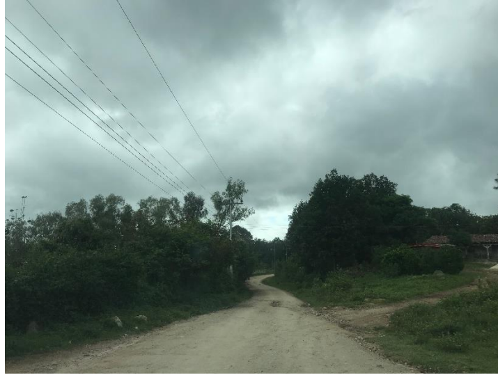
No. 3 VISTA DEL ESTADO ACTUAL DE LA CALLE Y EL ANCHO DEL DERECHO DE VIA.