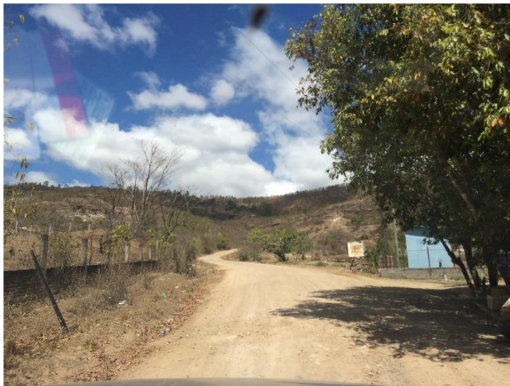
No. 4 FINAL DEL PROYECTO