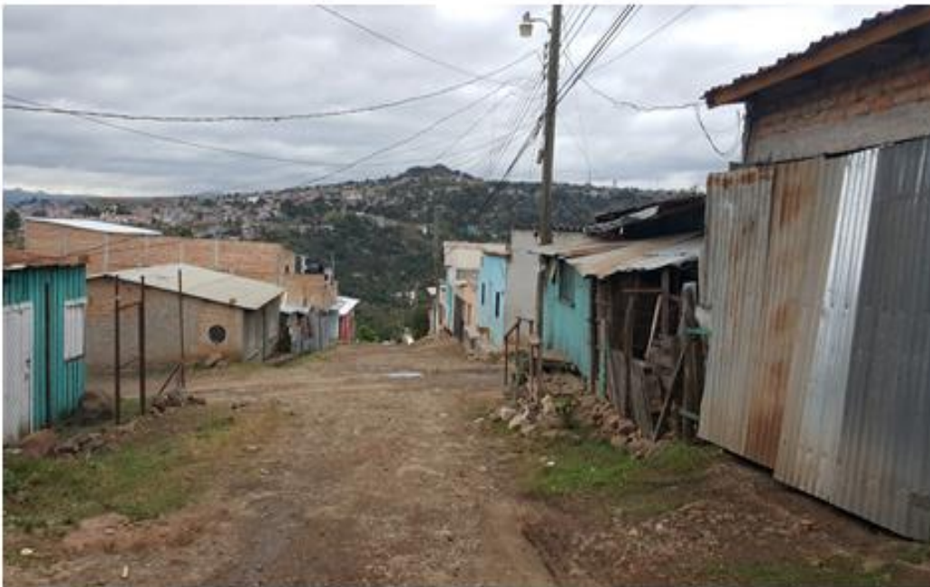
VISTA ACTUAL DE CALLE A BALASTAR