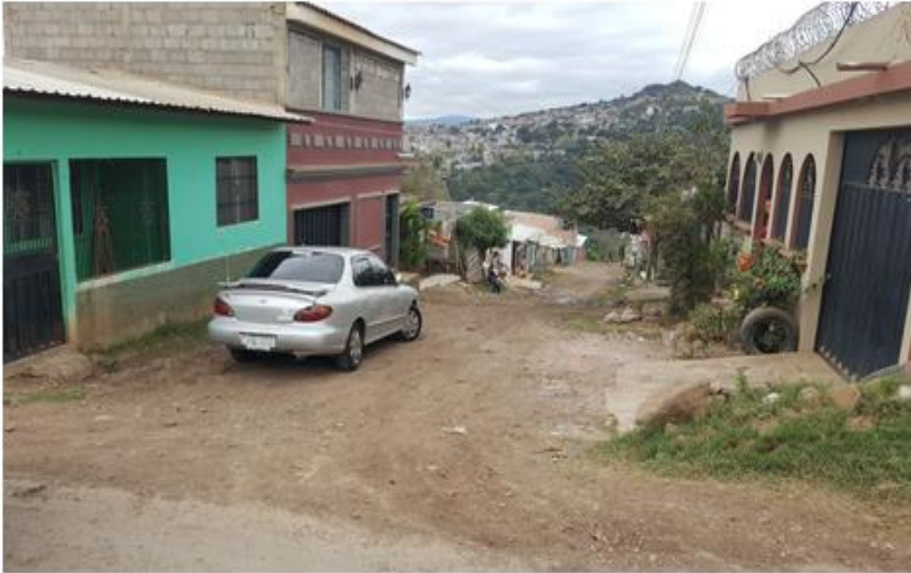
INICIO DE CALLE A BALASTAR