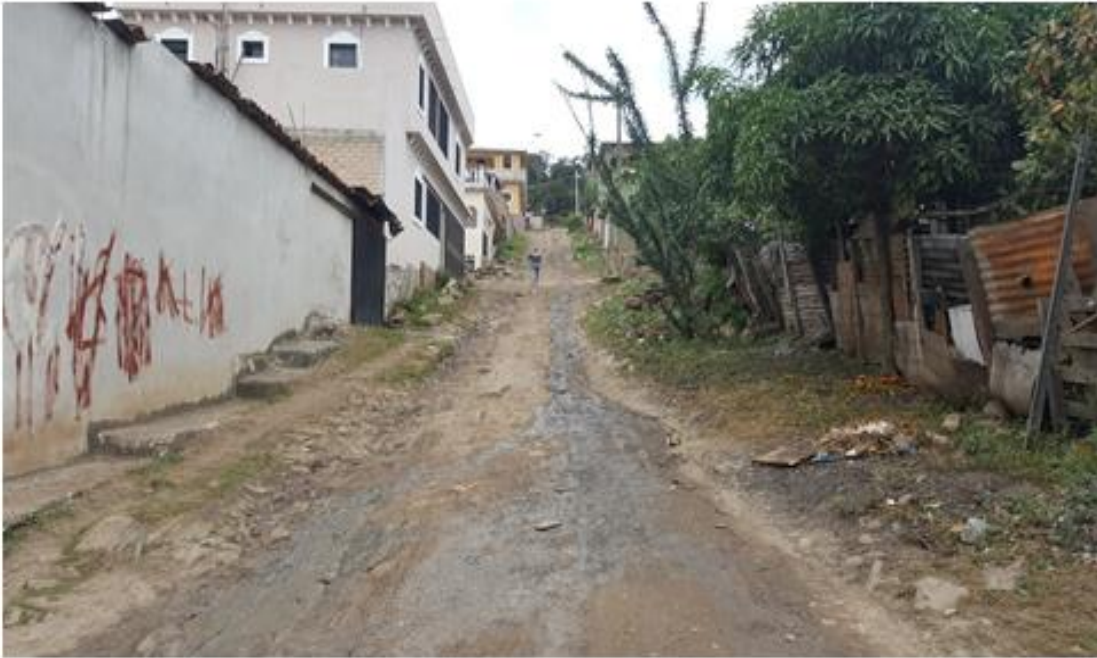
VISTA DE CALLE A BALASTAR