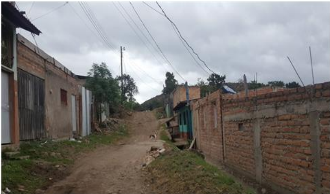
VISTA DE CALLE QUE REQUIERE BALASTADO