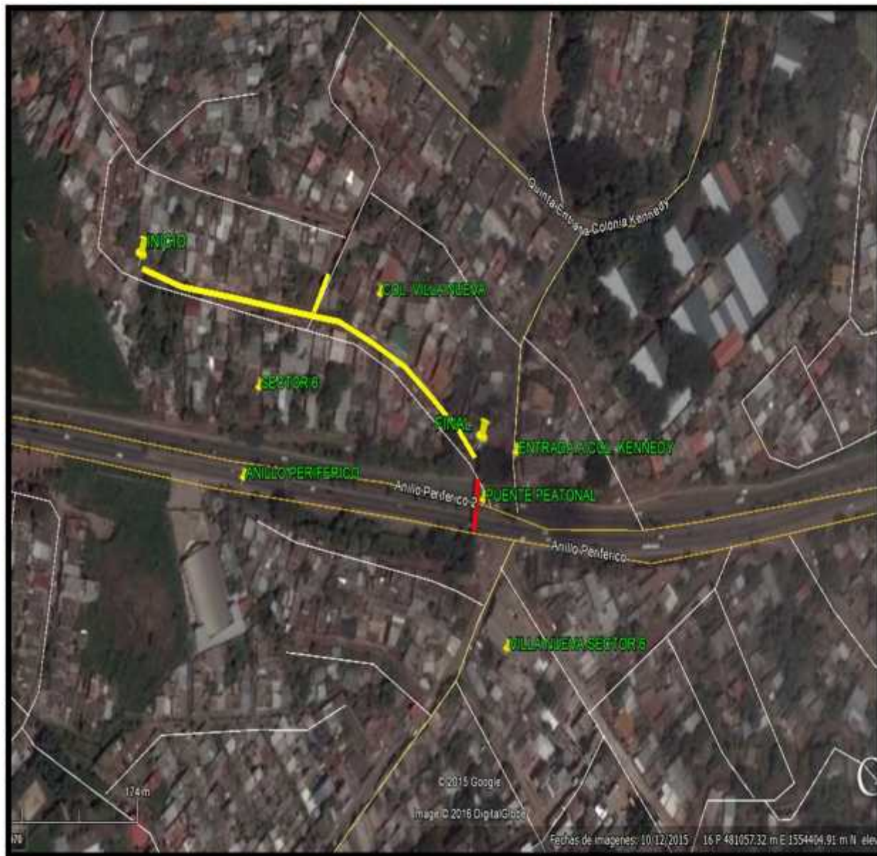
Ubicación del proyecto y calles a pavimentar