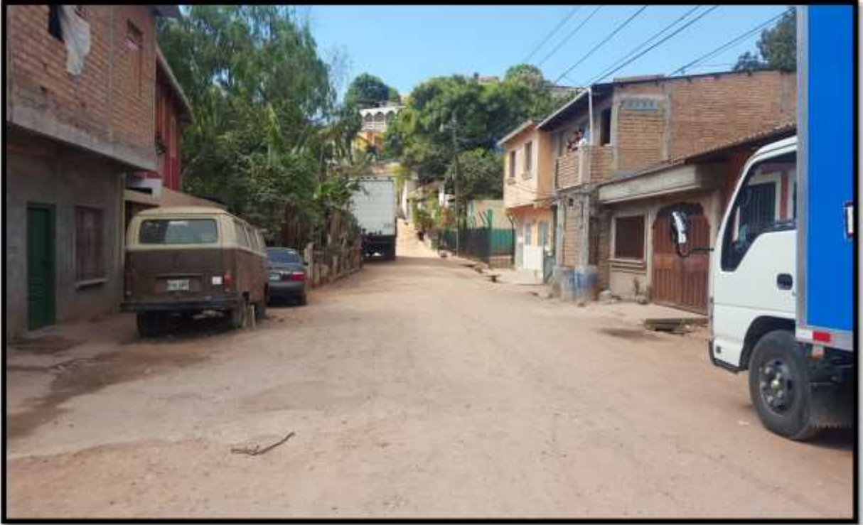
INICIO DE TRAMO A REPARAR