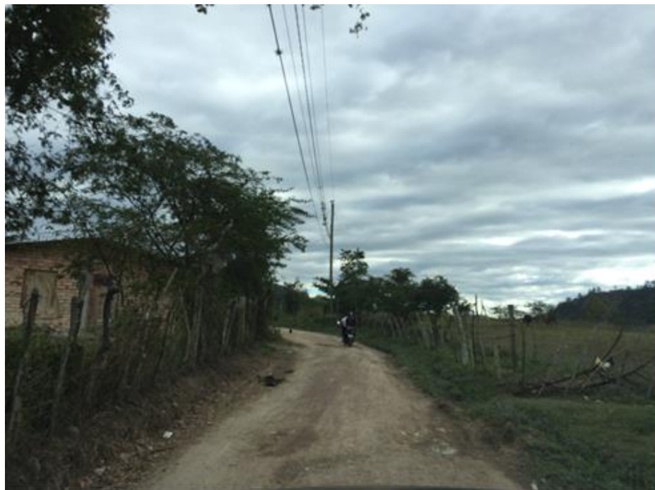
VISTA DE CALLE EN ALDEA EL AGUACATE