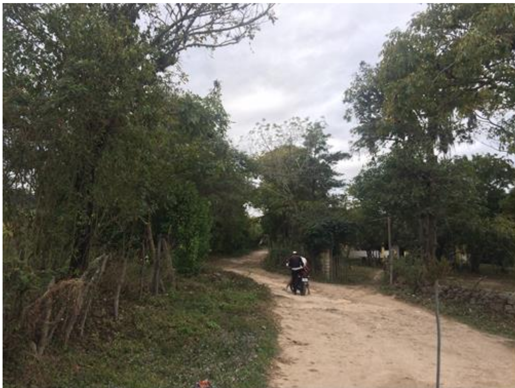
VISTA DE TRAMO DE CALLE A REPARAR