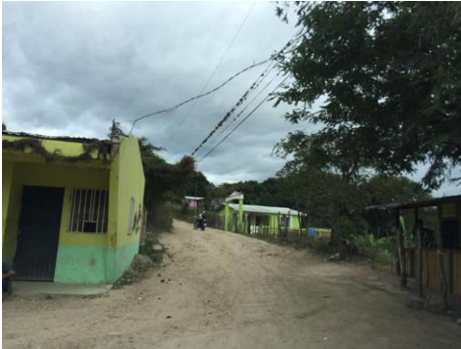
VISTA DE LAS CONDICIONES EN QUE SE ENCUENTRA LA CALLE A BALASTAR