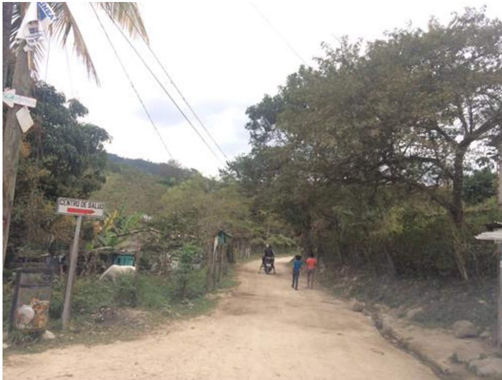
VISTA DE TRAMO EN ALDEA EL CERRO