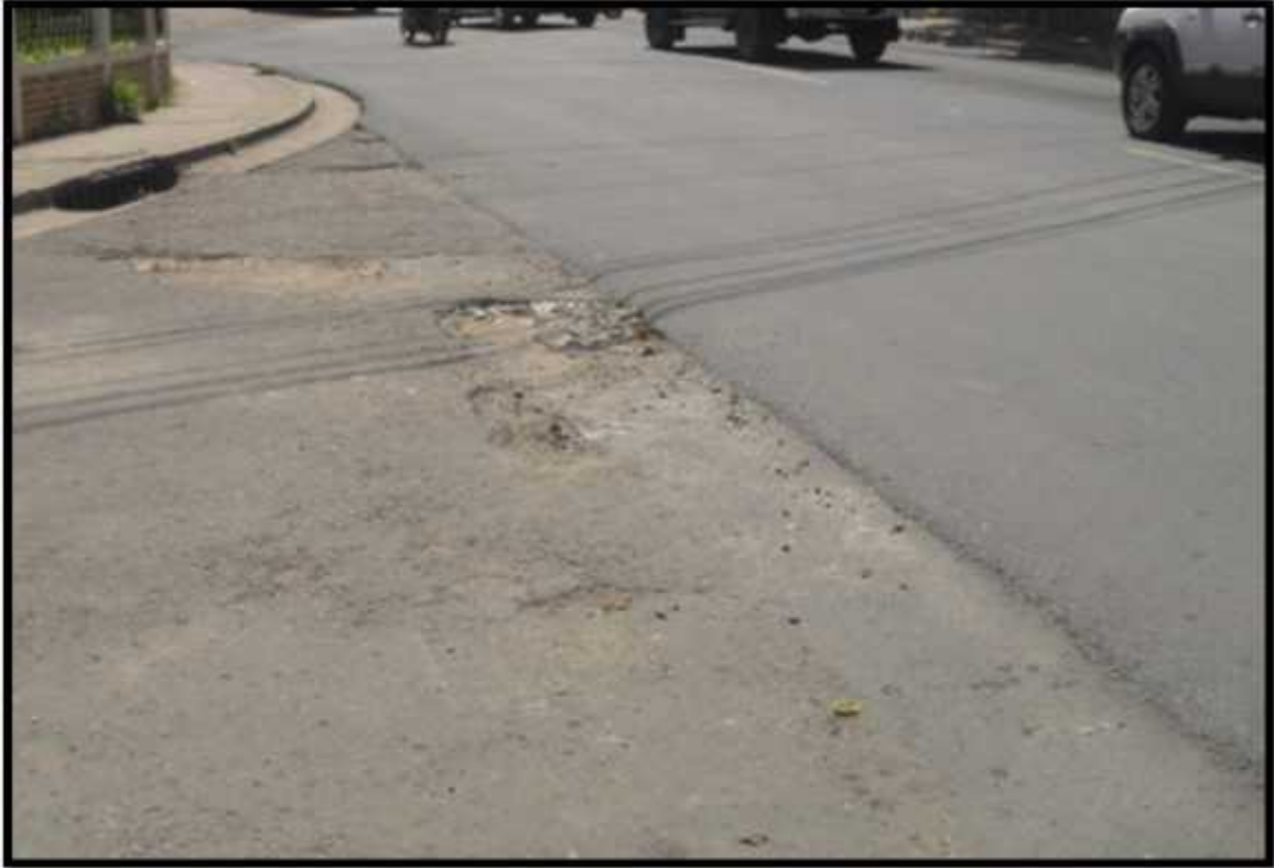
VISTA DEL MAL ESTADO DE LAS CALLES EN COL. PALMIRA