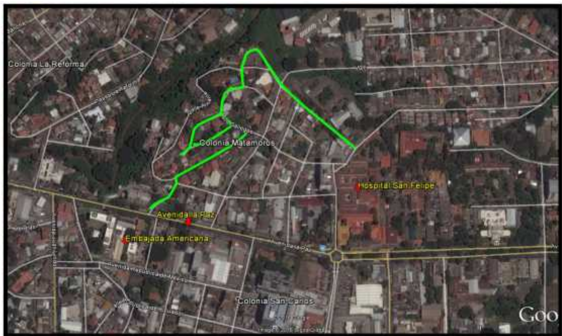
Ubicación del protecto y calles a pavimentar