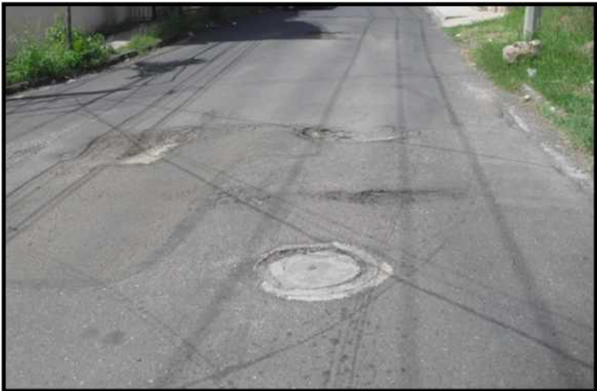
EN VARIOS PUNTOS SE HAN PRESENTADO FALLAS EN LA CAPA EXISTENTE