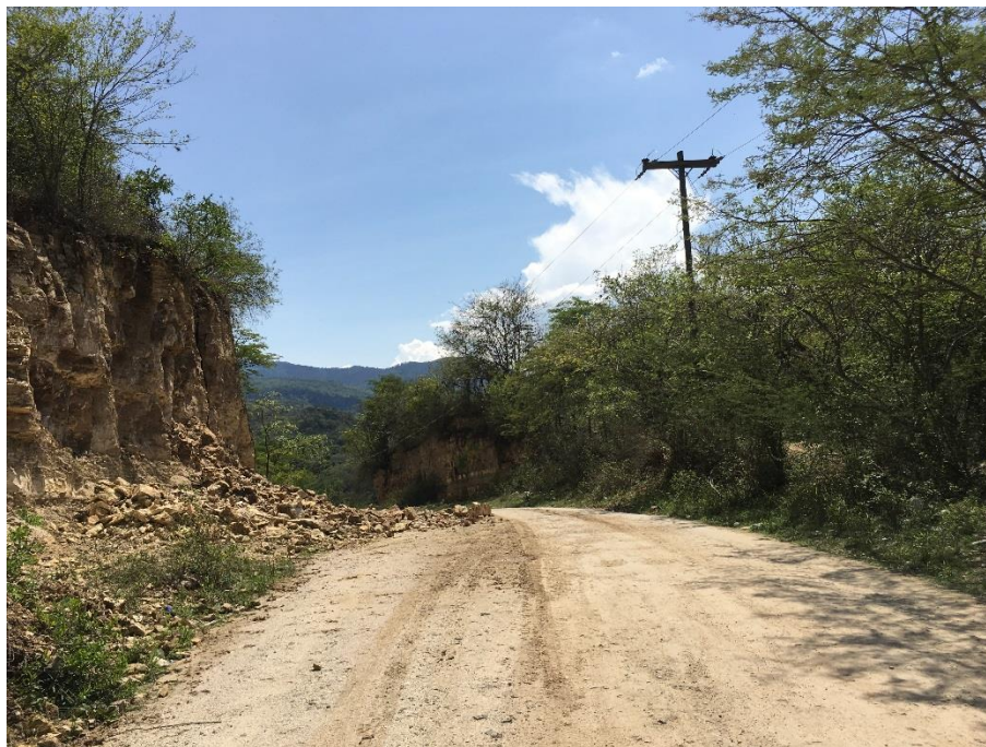
4. VISTA PANORAMICA DE TRAMO A REPARAR