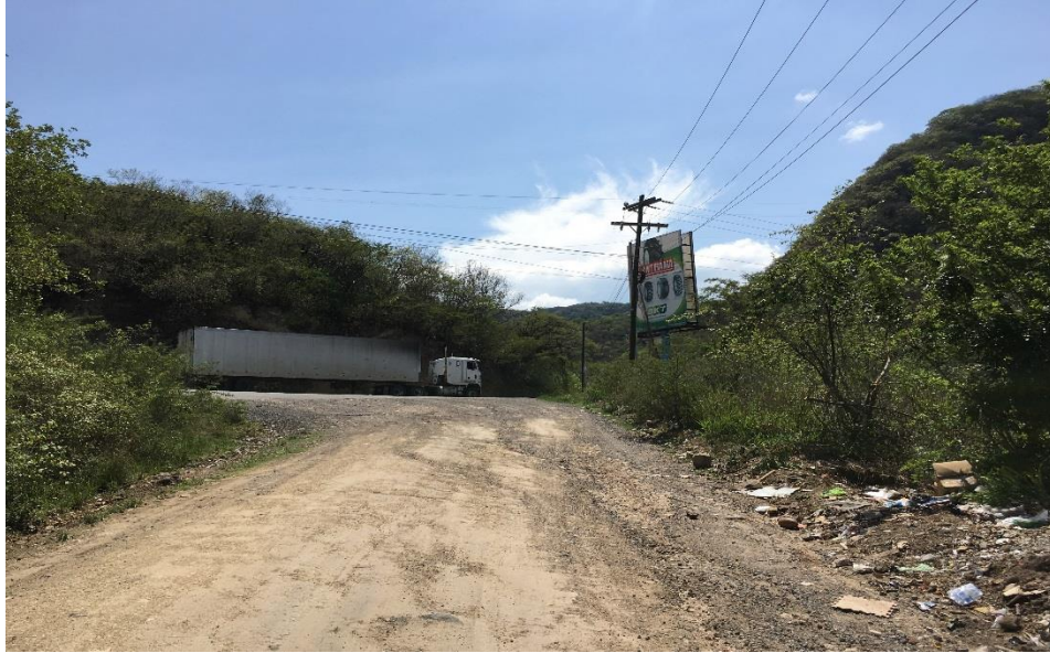
1. VISTA PANORAMICA DE TRAMO INICIAL A REPARAR

Proyecto: Conformación y balastado de calles, aldeas Casa Quemada-Cofradía Código: 1239