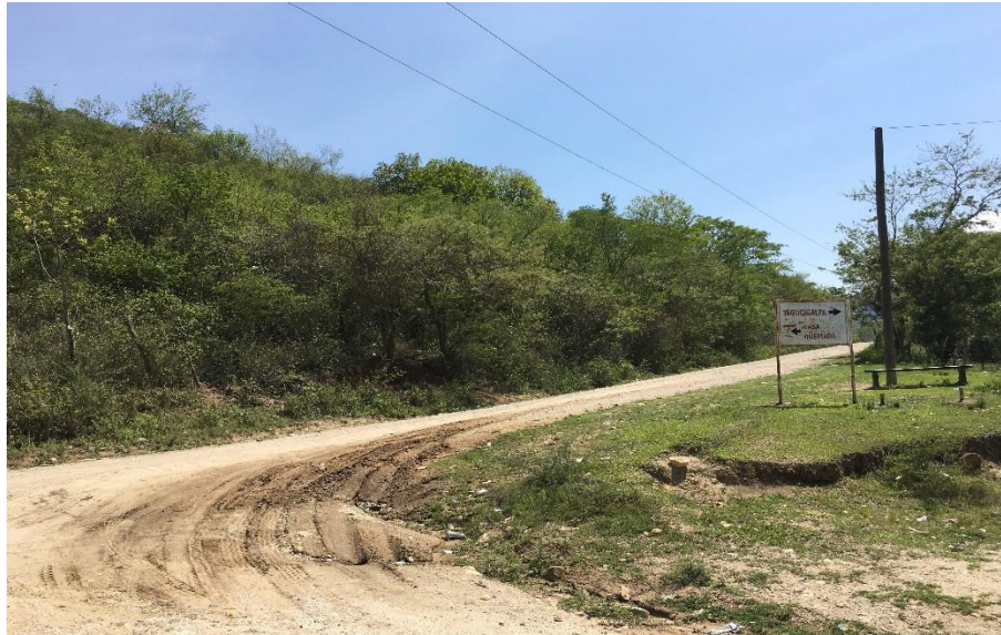
3. VISTA ACTUAL DEL TRAMO A REPARAR

Proyecto: Conformación y balastado de calles, aldeas Casa Quemada-Cofradía Código: 1239