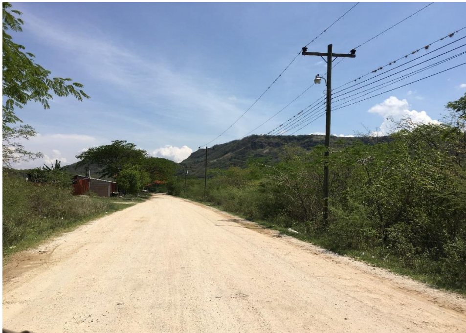
2. VISTA ACTUAL DEL TRAMO A CONFORMAR