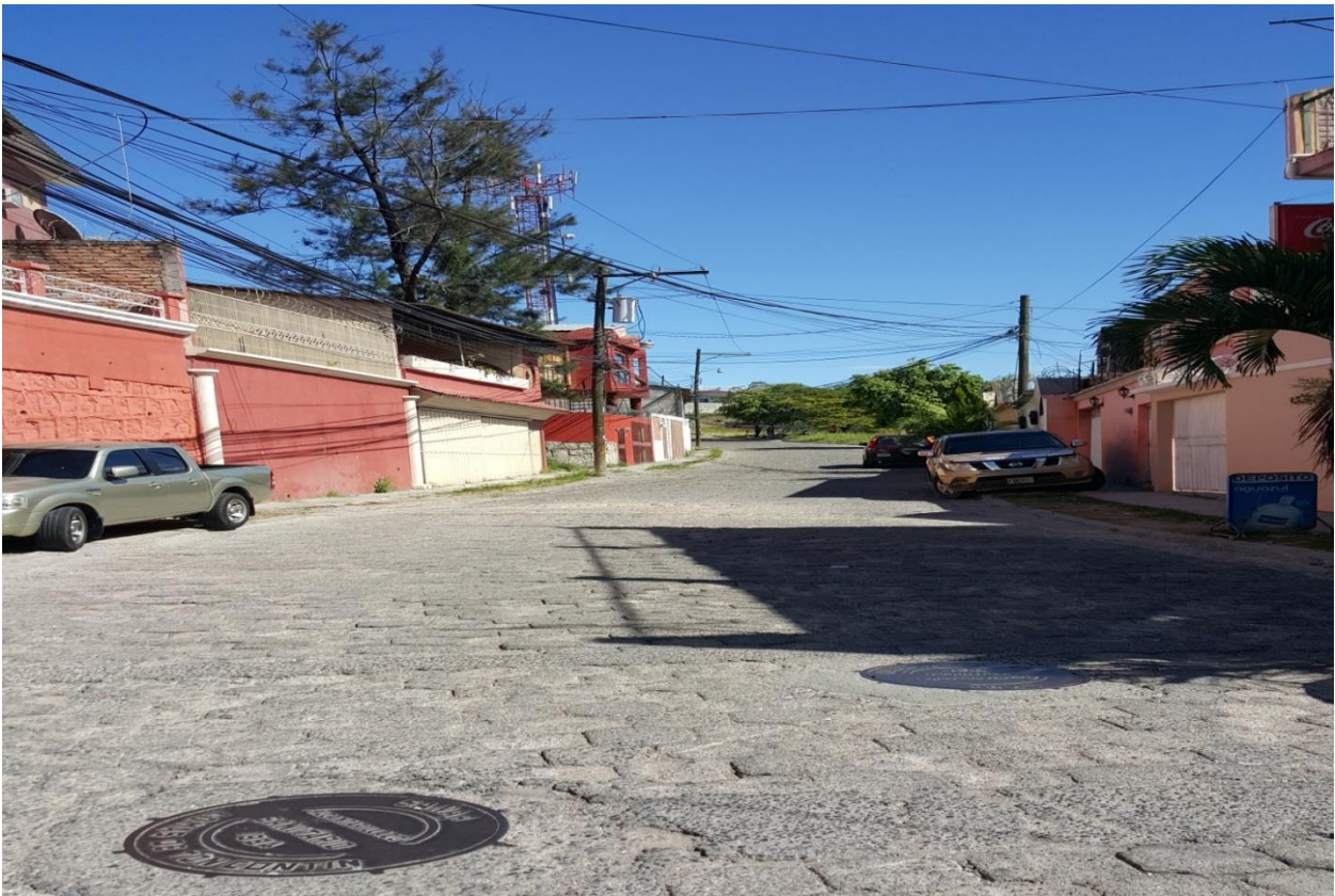
Vista panorámica de calle