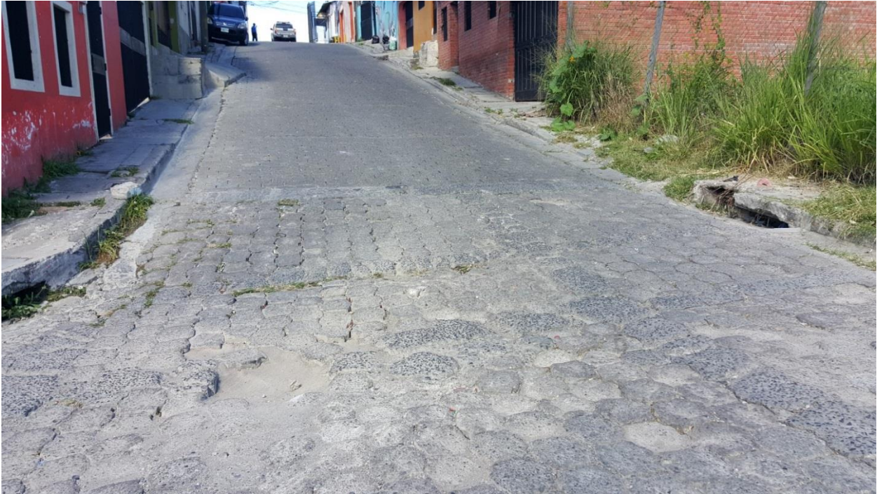
Inicio de calle a pavimentar