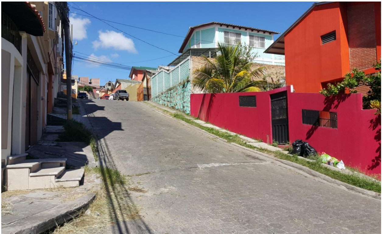
Fin de calle a pavimentar