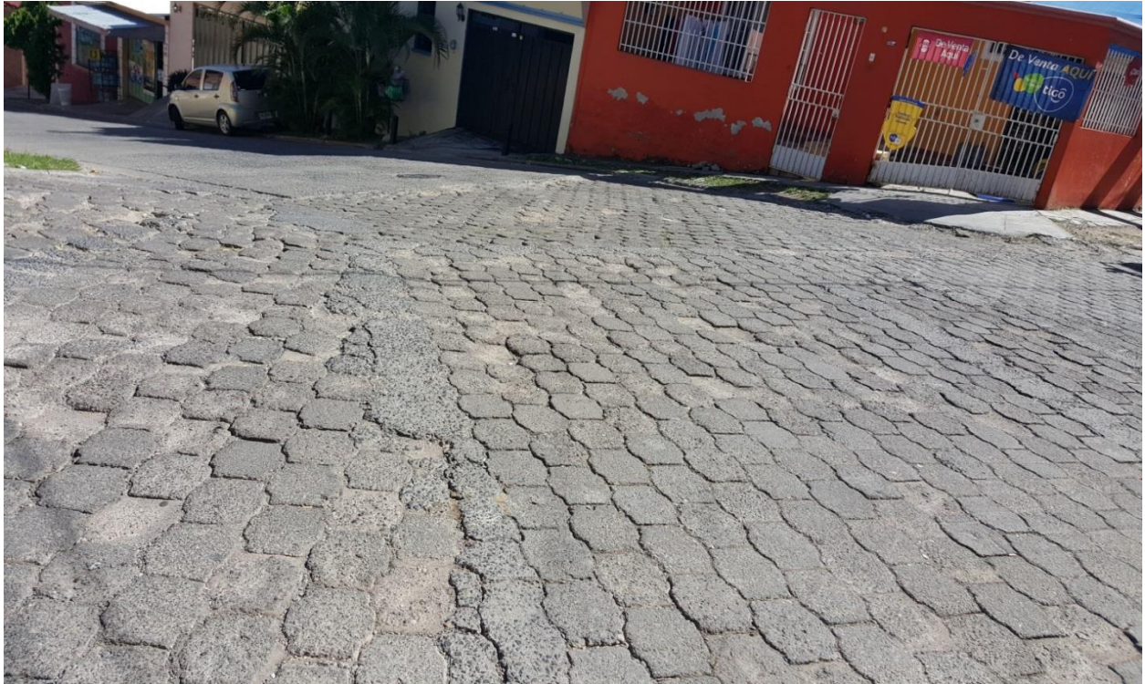
Vista de la calle