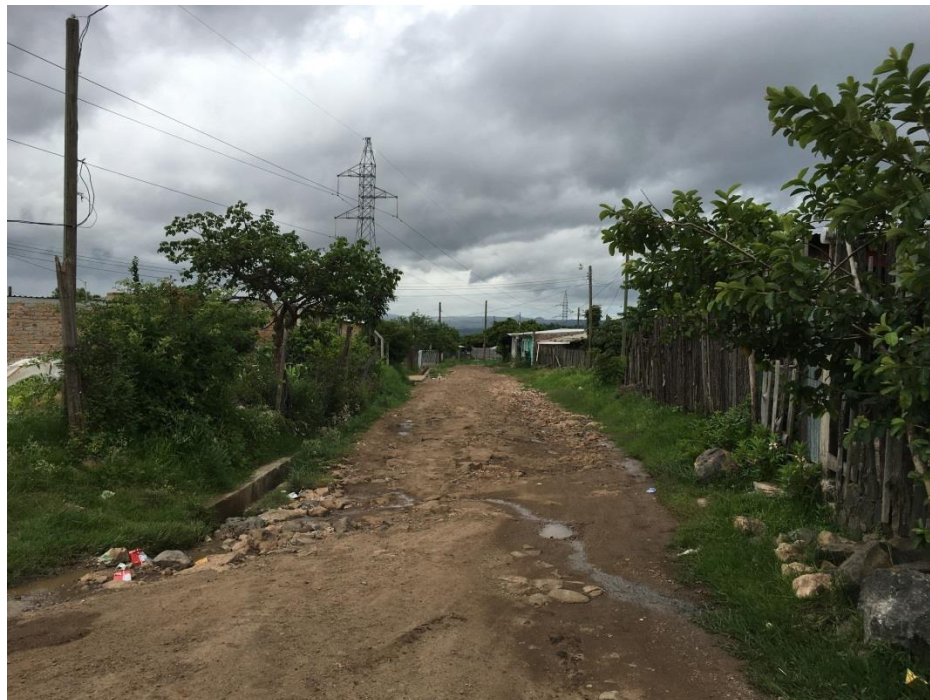
VISTA PANORAMICA DE TRAMO A REPARAR