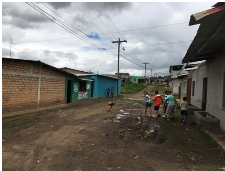
VISTA ACTUAL DEL MAL ESTADO DEL TRAMO A REPARAR