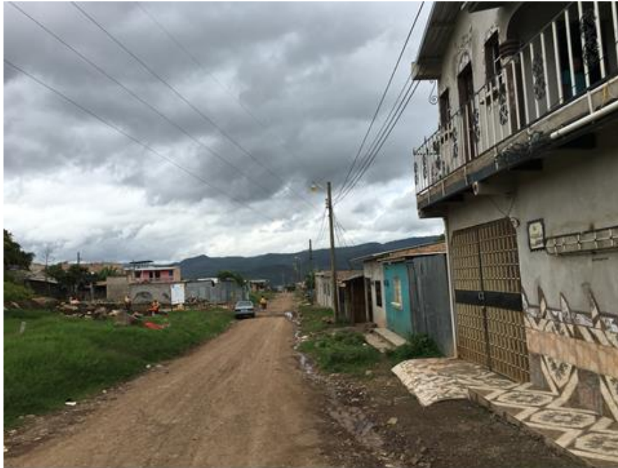
VISTA PANORAMICA DE TRAMO A REPARAR