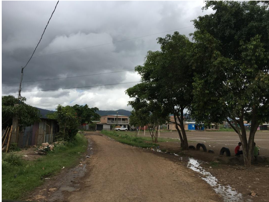
VISTA ACTUAL DEL TRAMO A REPARAR