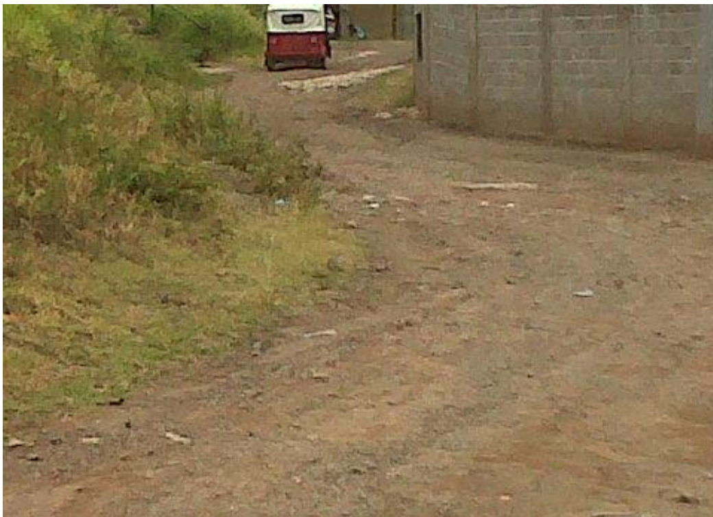
Construcción de empedrado y cunetas