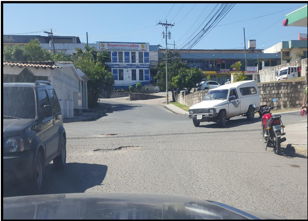
Vista del inicio de la reoaracion en el acceso a colonia cerro grande zona 4