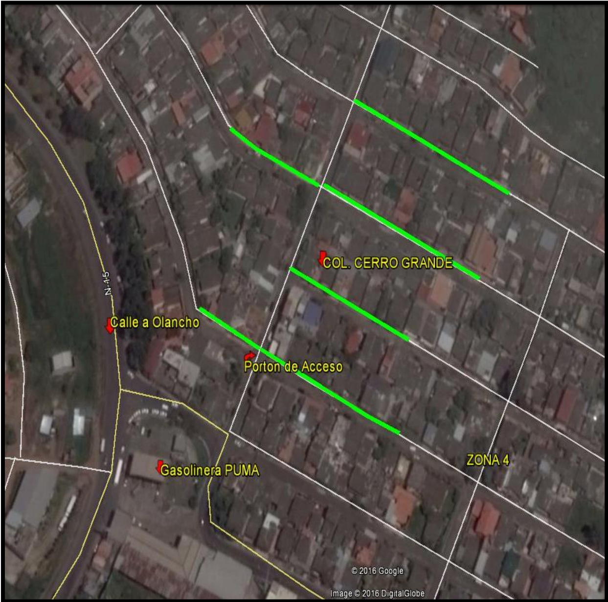
Croquis de ubicación