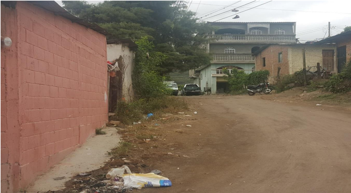
Vista del estado de calle