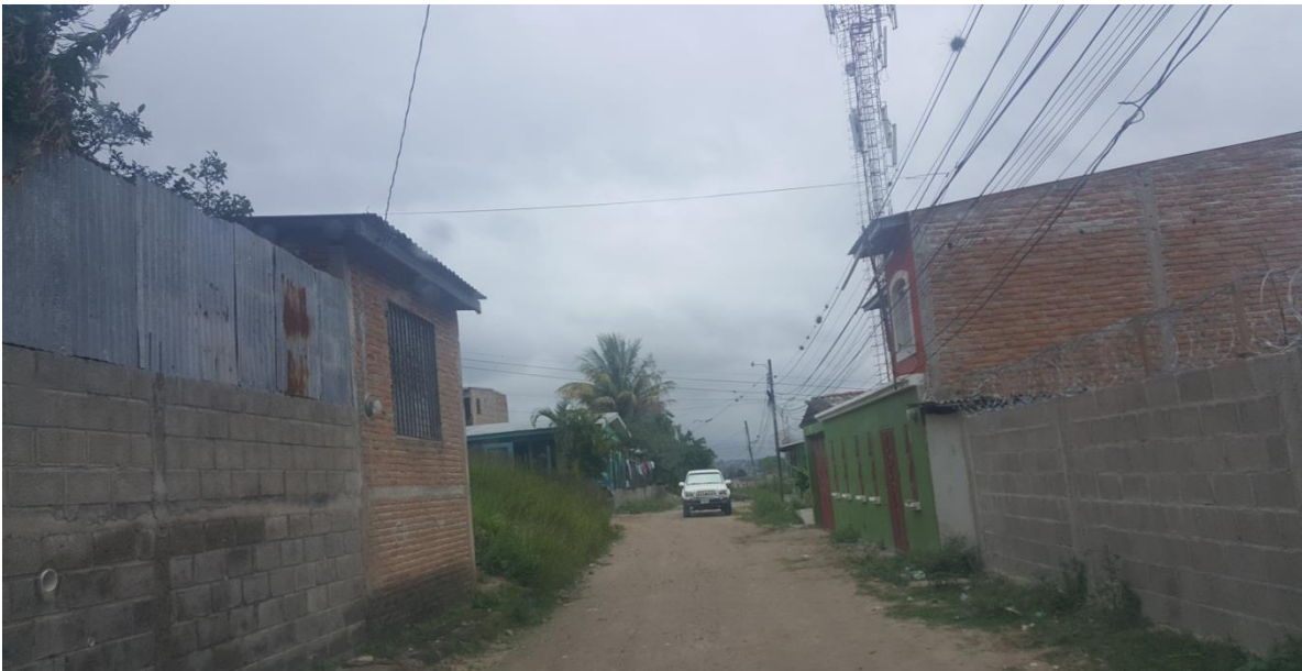
Vista Final de calle a pavimentar