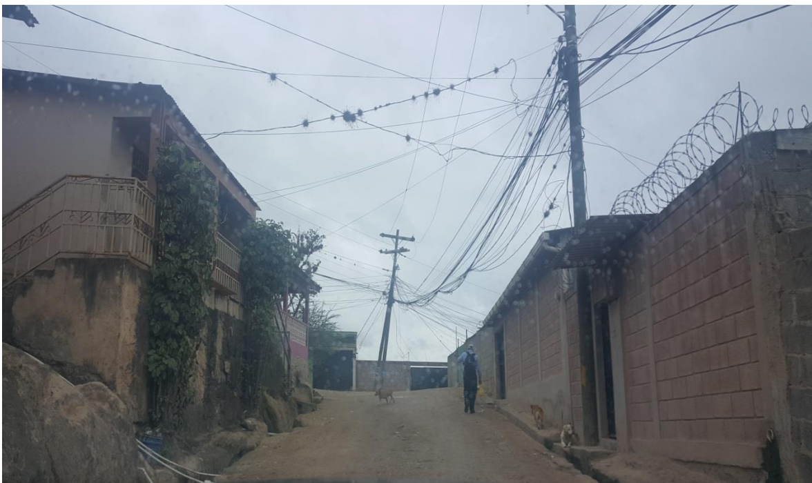
Panorama de calle a pavimentar