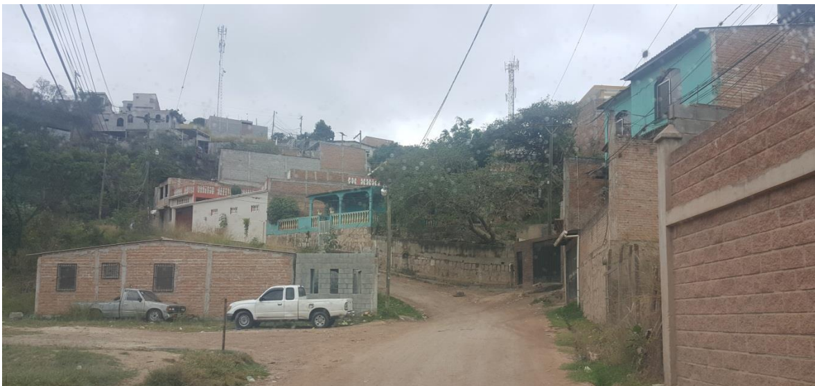
Inicio de calle a pavimentar