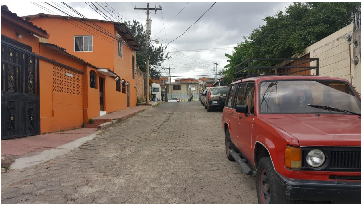
PANORAMA DE CALLE A PAVIMENTAR CON CONCRETO HIDRÁULICO