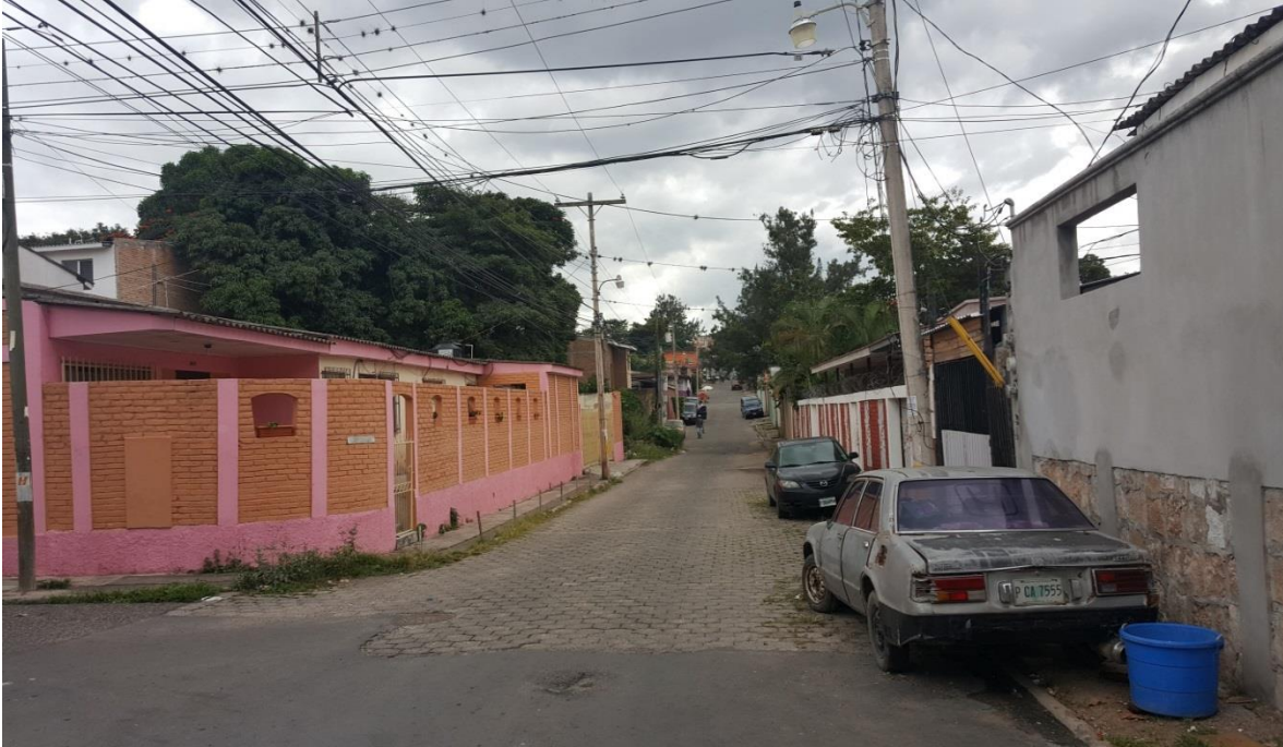
CALLE A PAVIMNTAR CON CONCRETO HIDRÁULICO