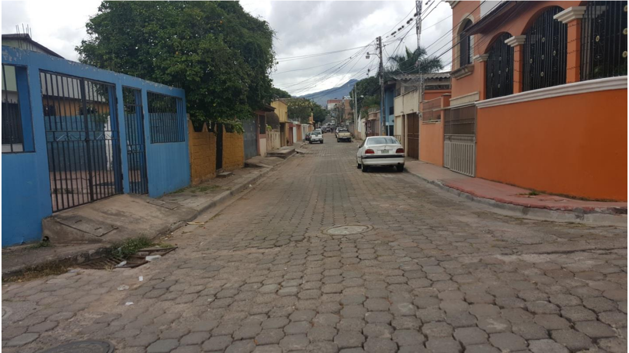
VISTA DE CALLE A PAVIMENTAR