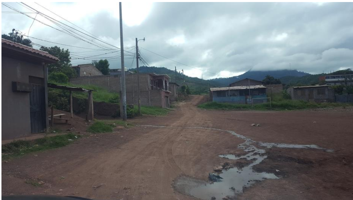
VISTA DE ESTADO ACTUAL DE CALLE A PAVIMENTAR