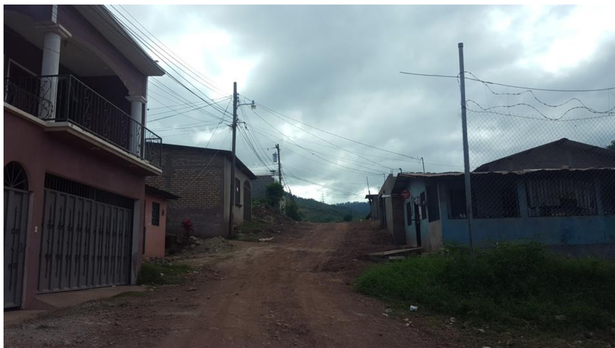
VISTA DE ESTADO ACTUAL DE CALLE A PAVIMENTAR