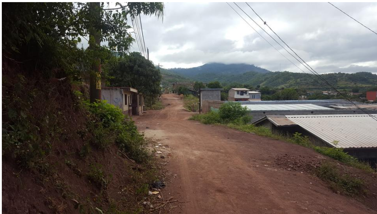
VISTA ACTUAL DE CALLE A PAVIMENTAR