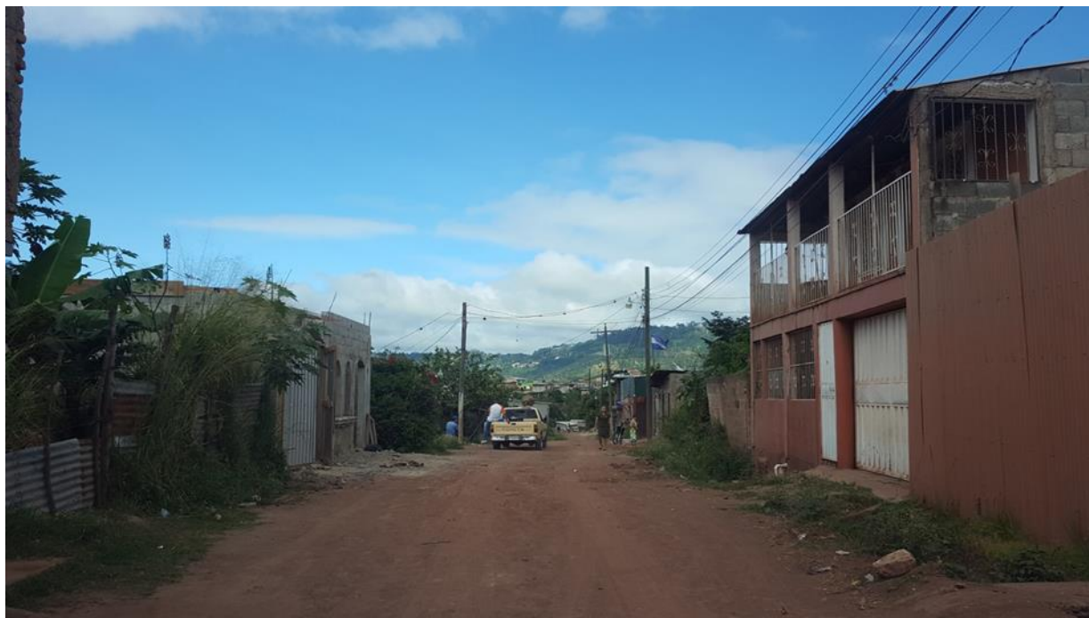
VISTA ACTUAL DE CALLE A PAVIMENTAR