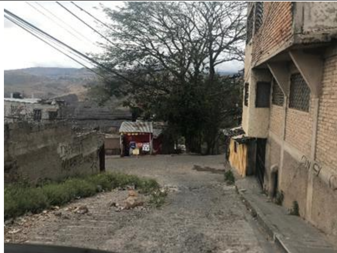
VISTA DE CALLE A DEMOLER