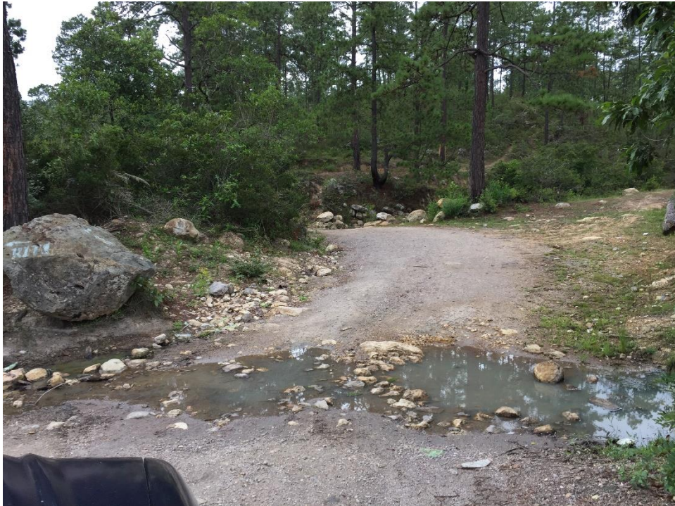
VISTA DE TRAMO DONDE SE COLOCARA ALCANTARILLA PVC DE 24" DOBLE PARED