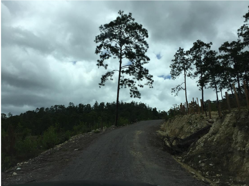
VISTA DE TRAMO DE CALLE A REPARAR