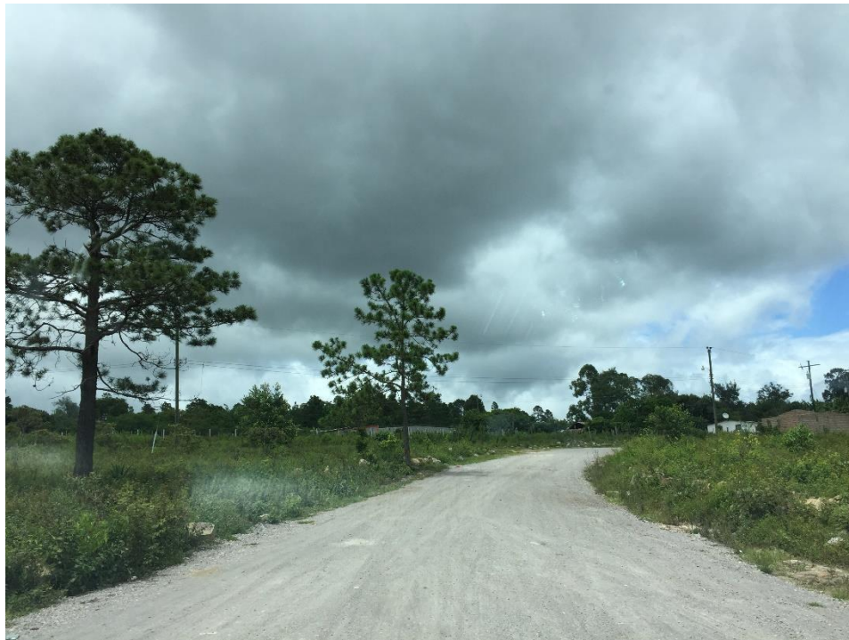
VISTA DE LAS CONDICIONES EN QUE SE ENCUENTRA LA CALLE A BALASTAR