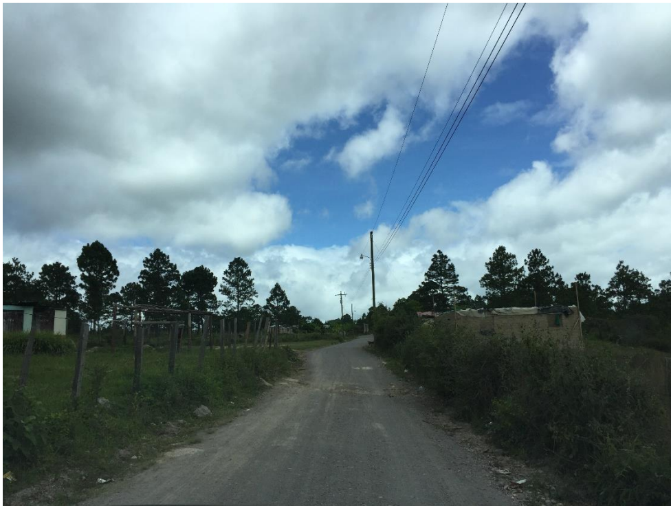
VISTA DE CALLE A CONFORMAR Y BALASTAR