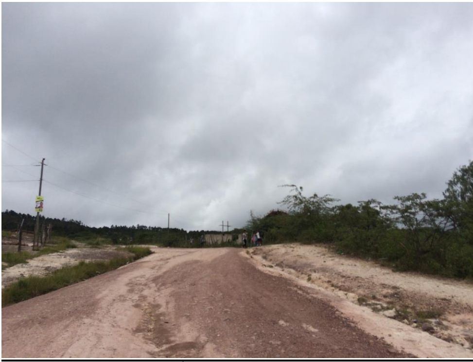
VISTA PANORÁMICA DE CALLE A REPARAR