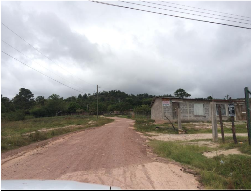
INICIO DE CALLE A REPARAR