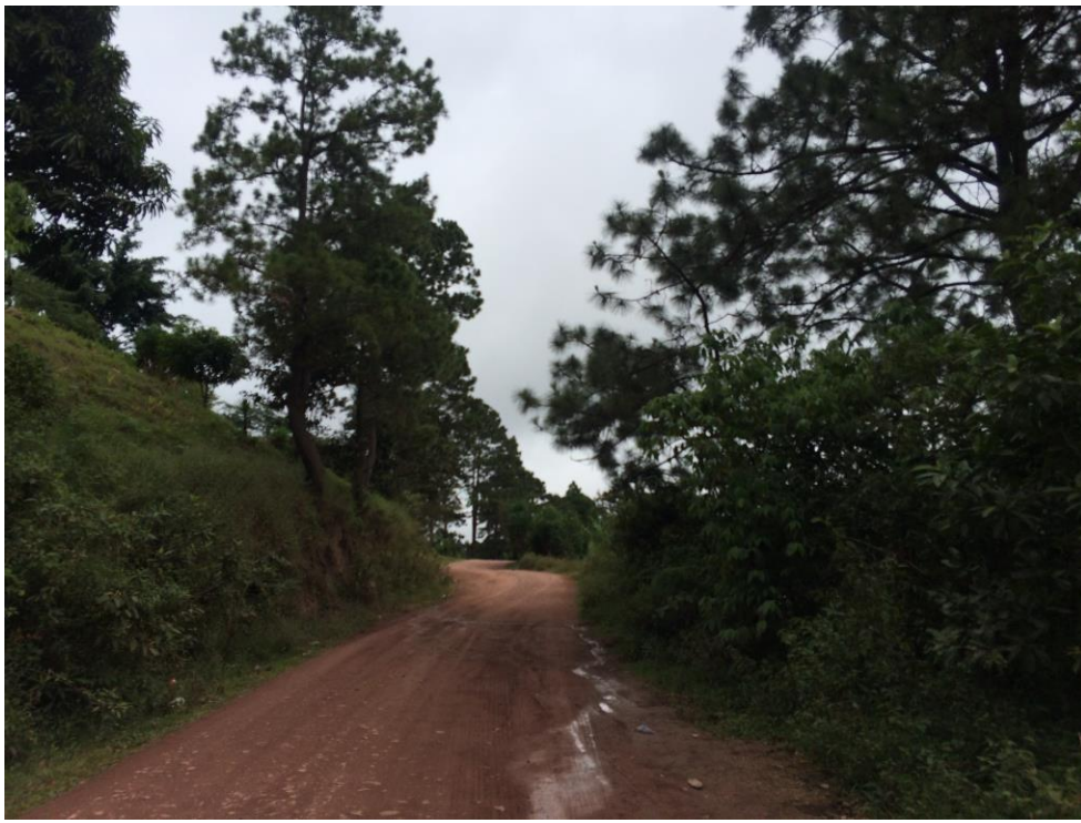
FINAL DE CALLE QUE REQUIERE BALASTADO