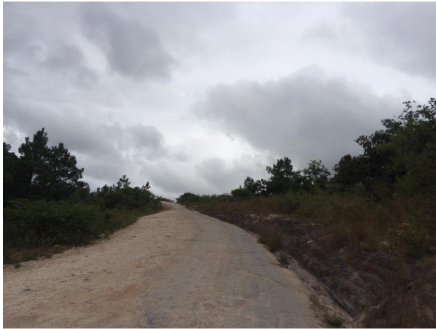
VISTA ACTUAL DE CALLE A REPARAR