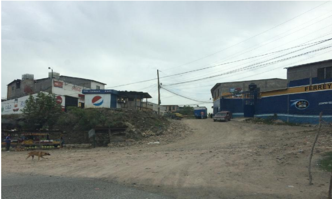
Inicio de calle a pavimentar frente a Ferre y Más