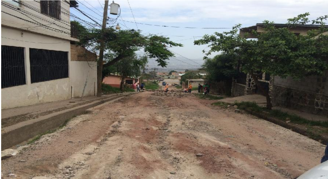
Vista de otro tramo de la calle a pavimentar