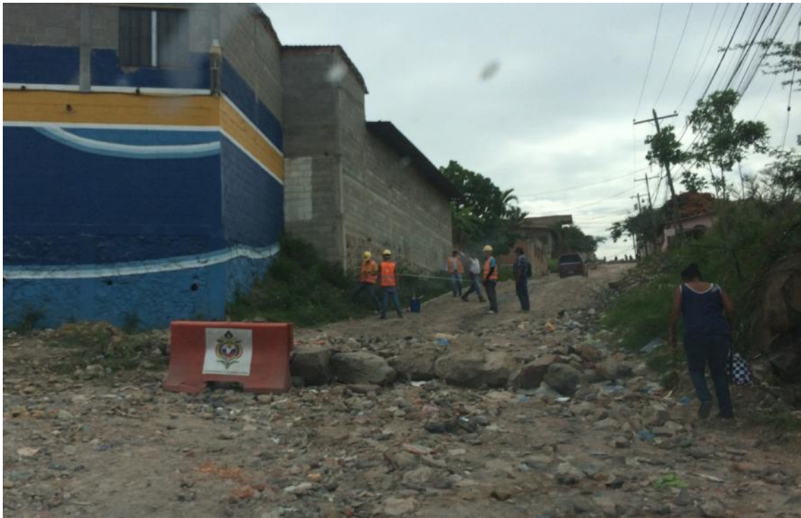
Vista panorámica de calle