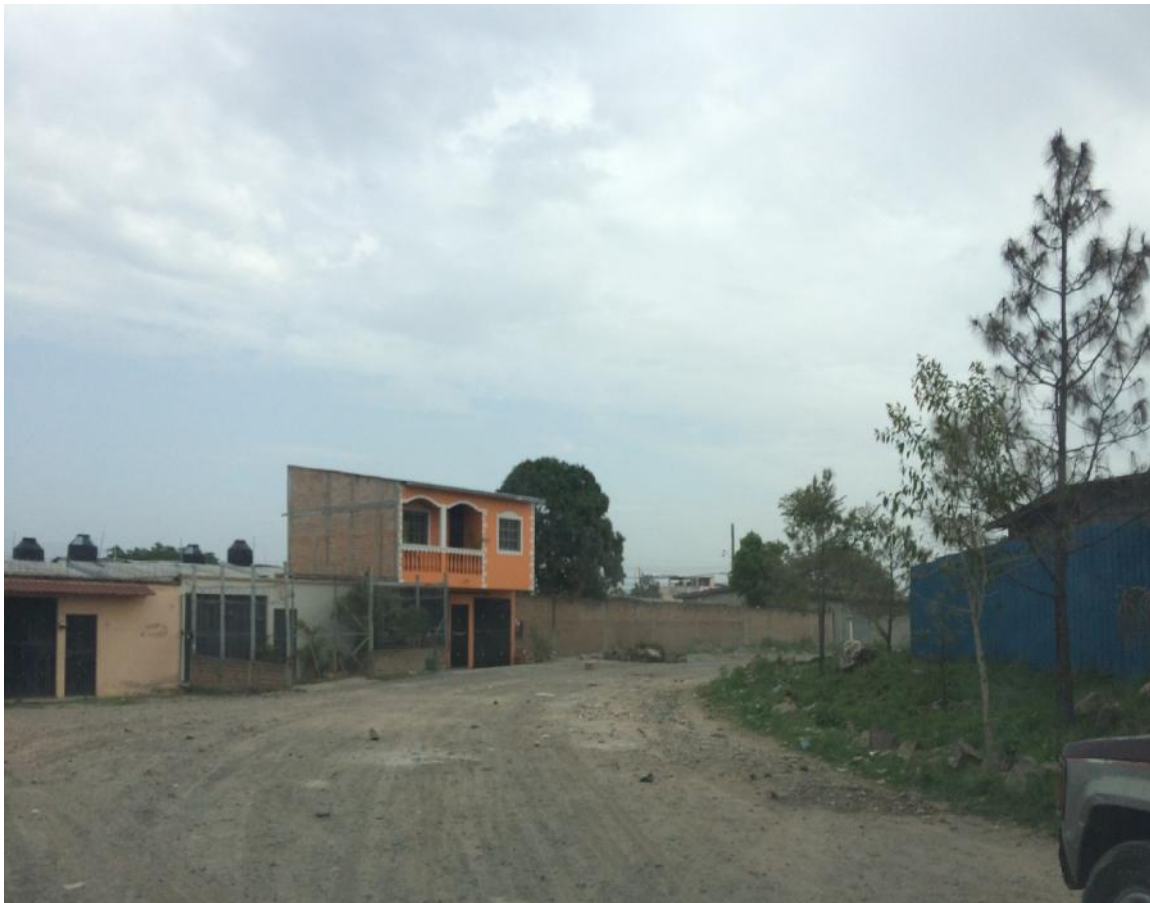
Final de calle a pavimentar