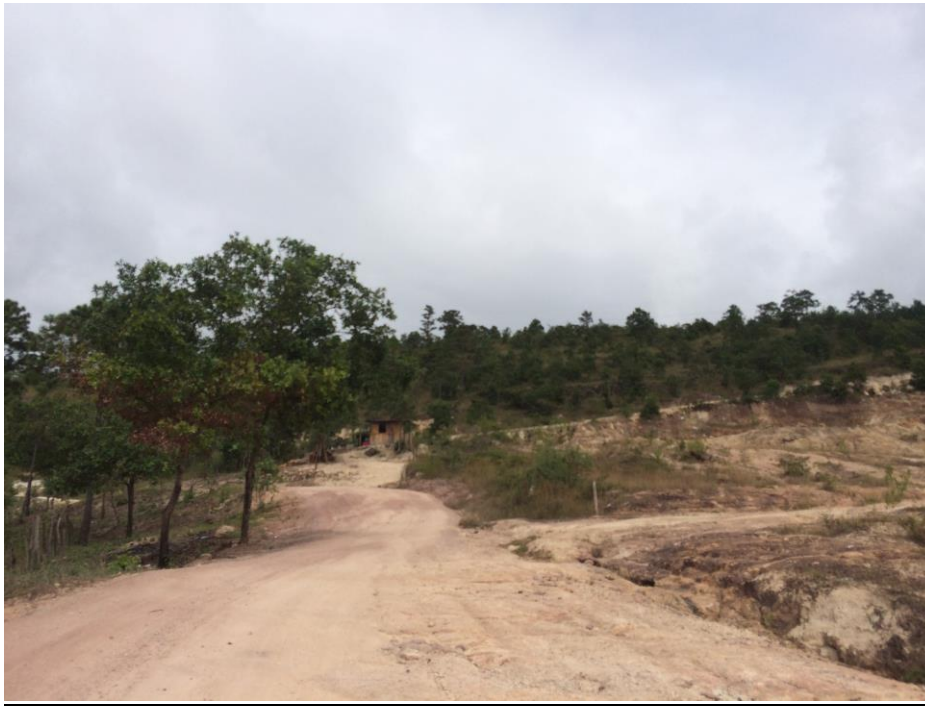
FINAL DE CALLE QUE SE BALASTARA