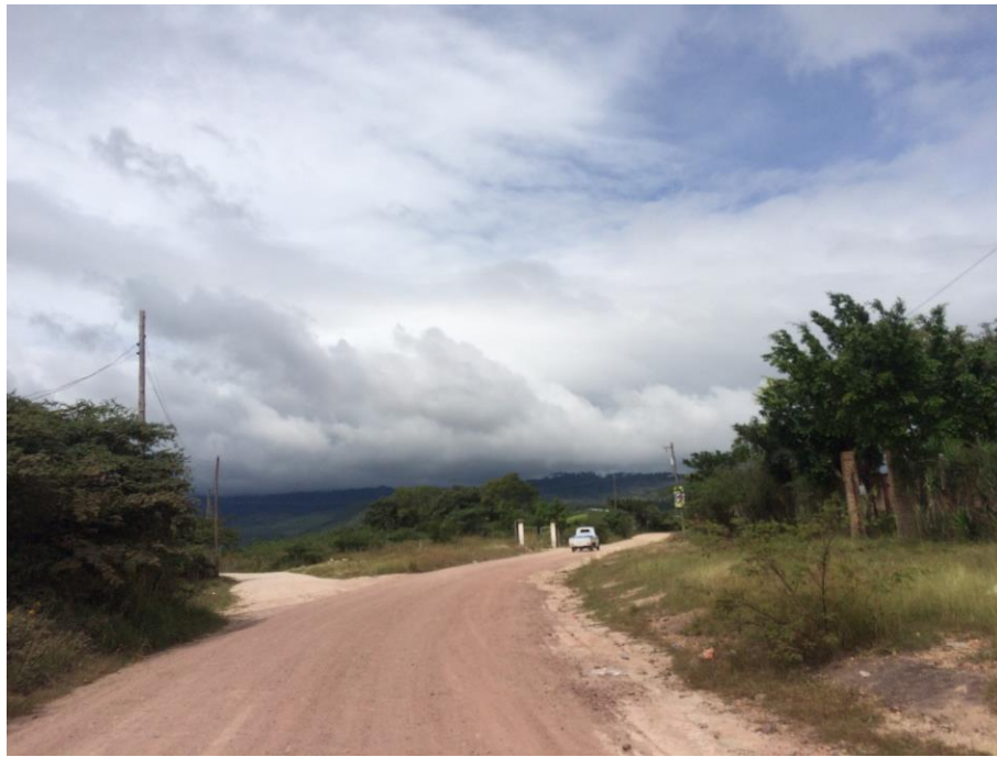
VISTA ACTUAL DE CALLE A REPARAR