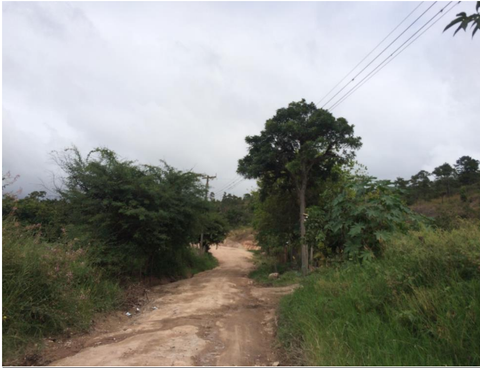
VISTA PANORÁMICA DE CALLE A REPARAR