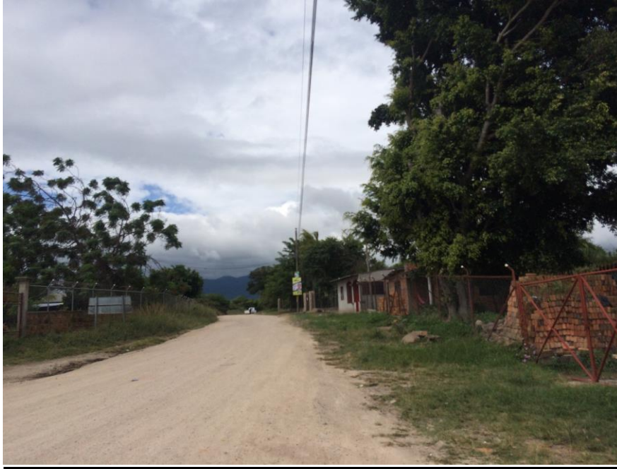
INICIO DE CALLE A REPARAR