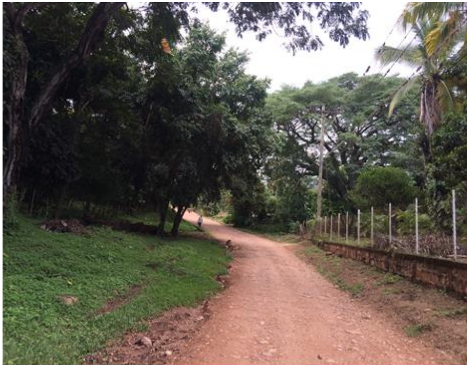
VISTA DEL ESTADO ACTUAL DE LA CALLE