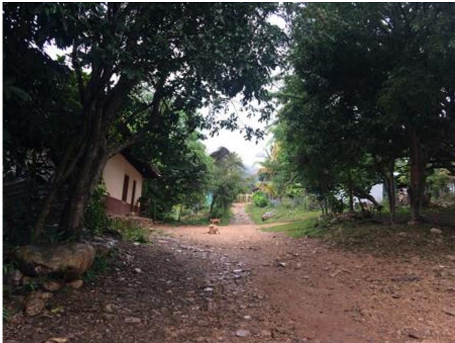
VISTA PANORÁMICA DE CALLE A REPARAR