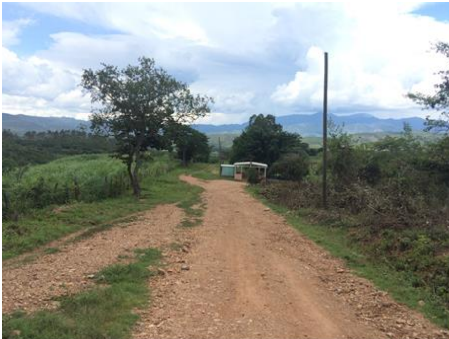
VISTA DE LA CALLE A BALASTAR