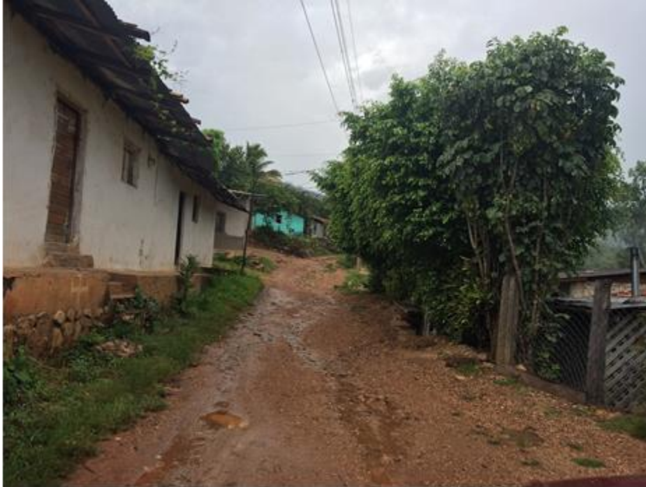
VISTA DE CALLE A REPARAR