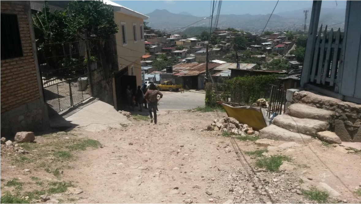
Calles a pavimentar