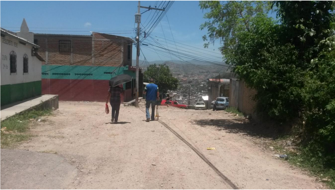
Calles a pavimentar