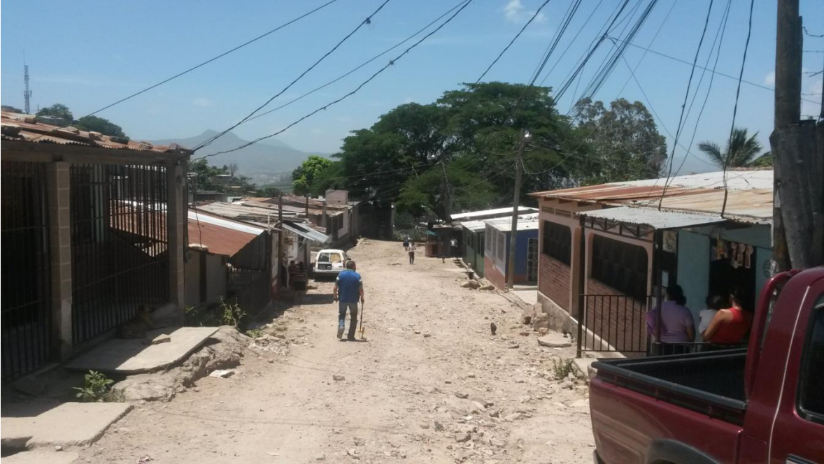
Calles a pavimentar