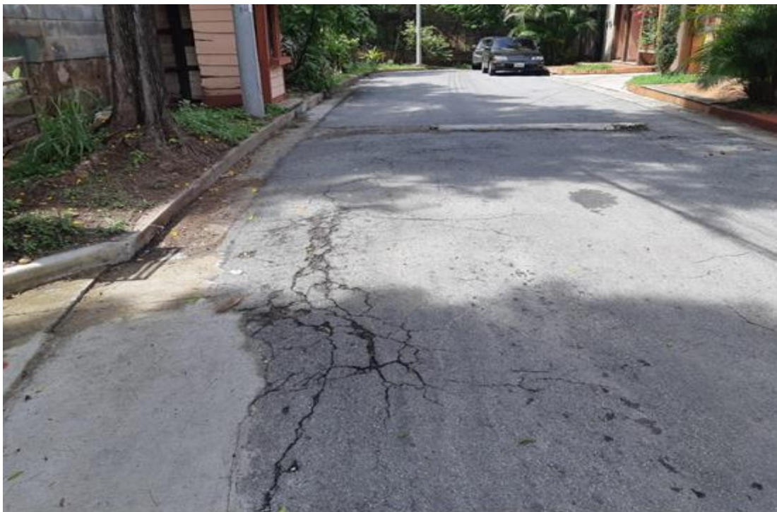
En la imagen se observa las fallas en la superficie de uno de los tramos a rehabilitar con mezcla asfáltica