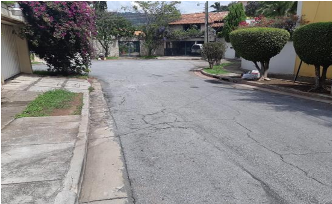
En la imagen se aprecia un tramo intermedio de las calles a rehabilitar