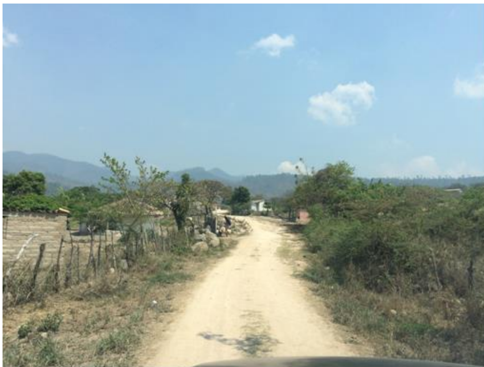
VISTAS DE TRAMO FINAL DEL PROYECTO