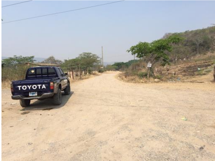
TRAMOS A REPARAR EN ACCESO A SAN JOSÉ DEL POTRERO