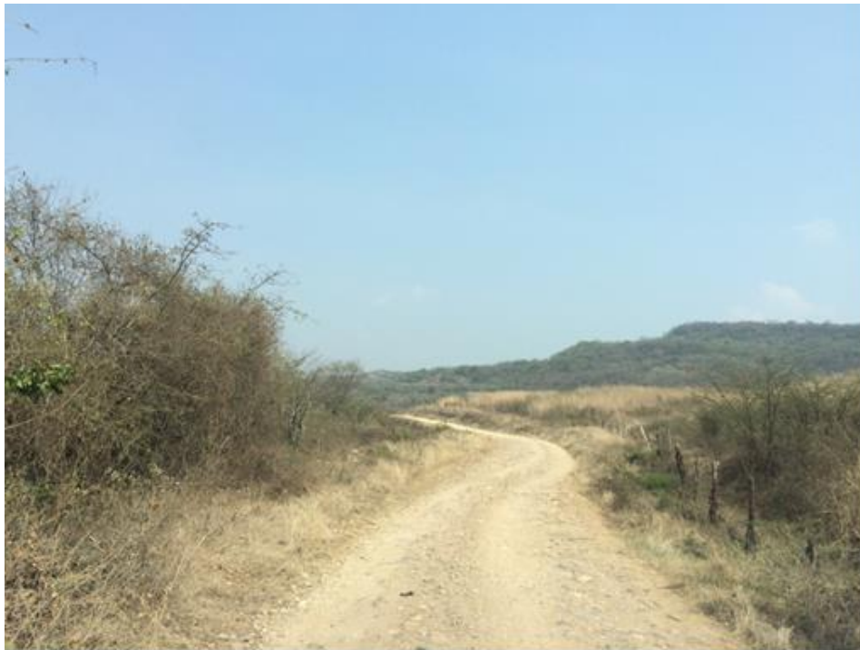
VISTAS DE TRAMOS EN MAL ESTADO