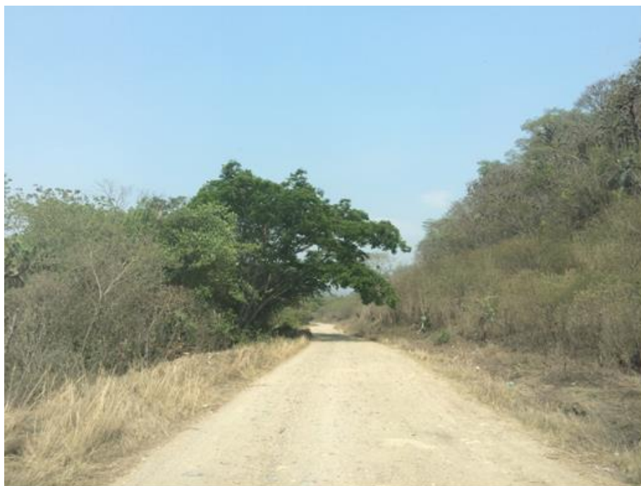
VISTA DEL MAL ESTADO DE UN TRAMO A BALASTAR