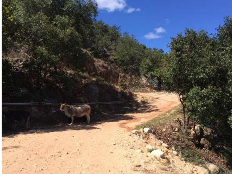
VISTA DE LAS CONDICIONES EN QUE SE ENCUENTRA LA CALLE A BALASTAR