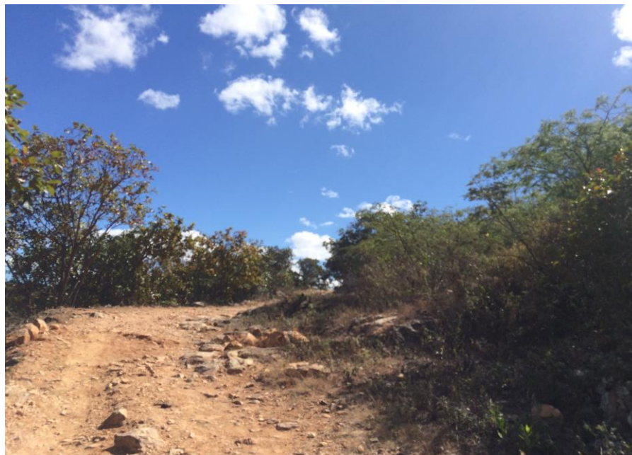
VISTA DE CALLE EN ALDEA LOS CHARCOS