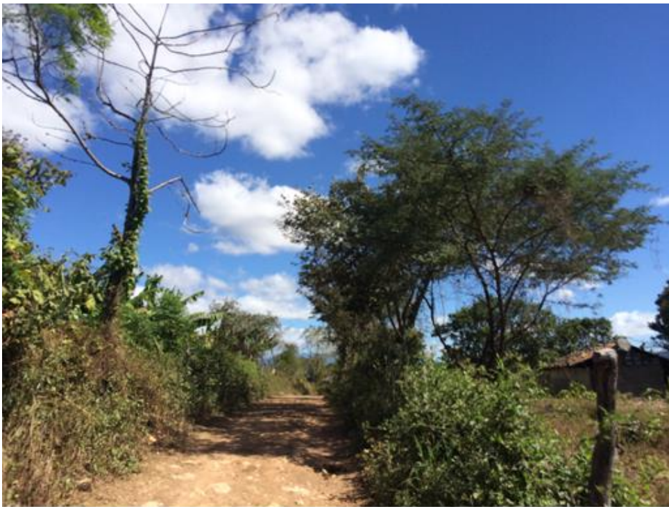
VISTA DE TRAMO DE CALLE A REPARAR