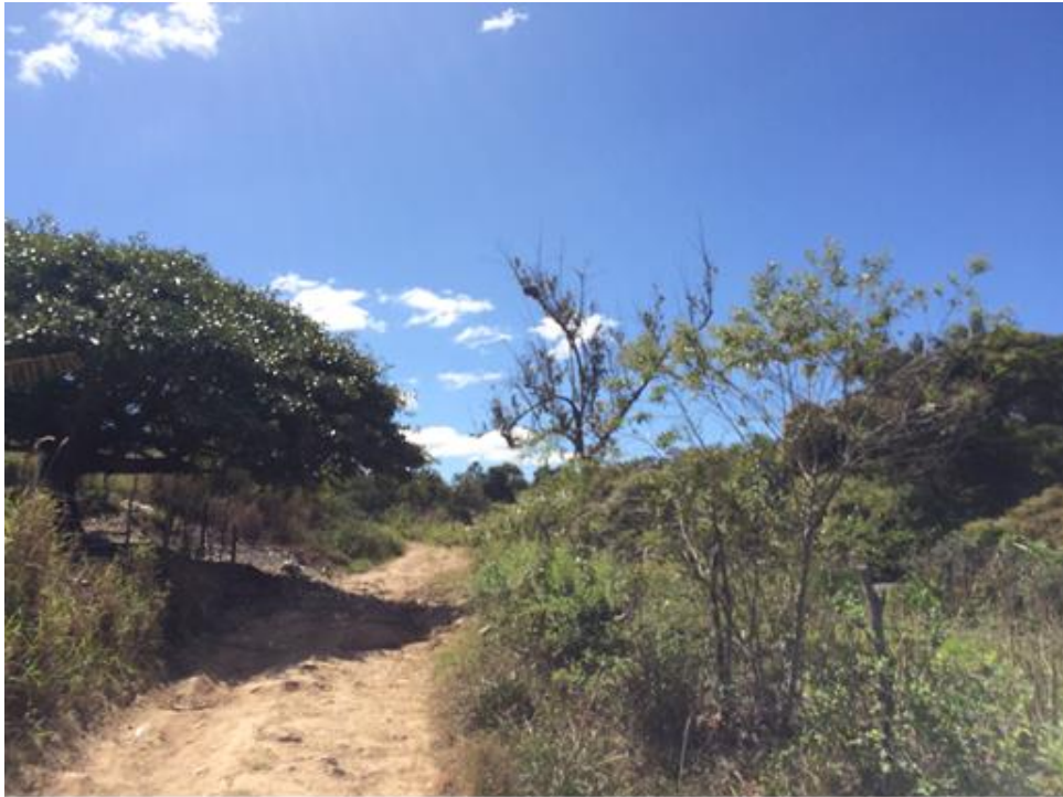
VISTA DE TRAMO A BALASTAR