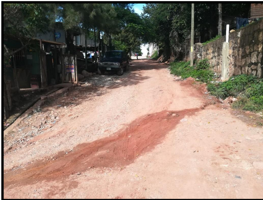
No.2 Vista intermedia, ancho promedio 6.00 m.