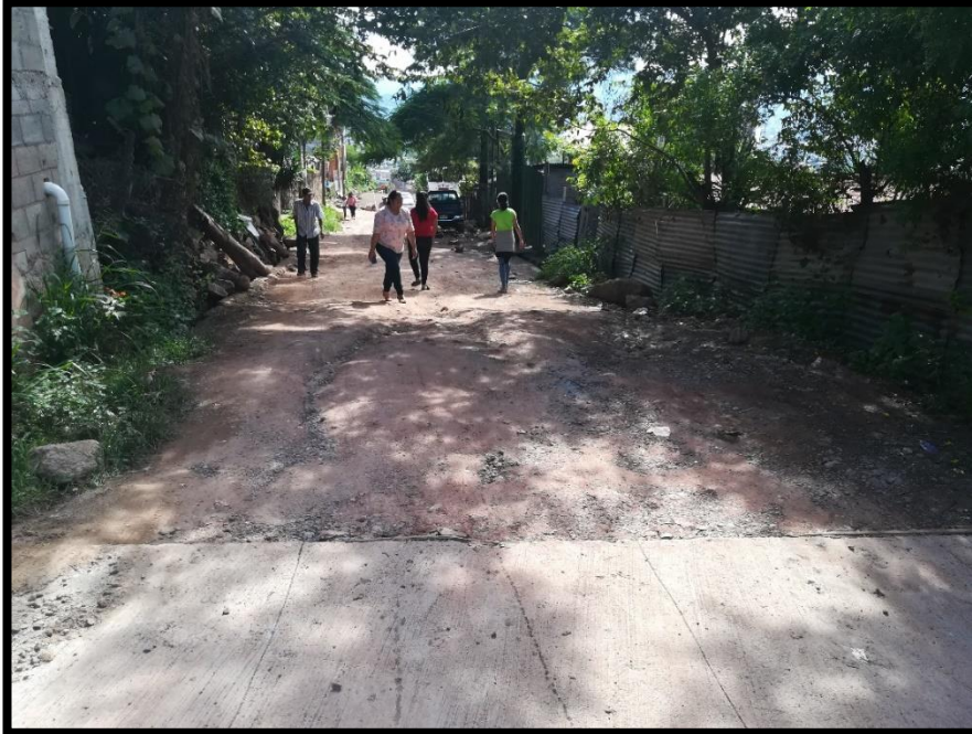
No.1 Inicio de calle a pavimentar, se observa la necesidad del proyecto.