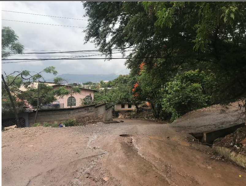
VISTA DE LOS DAÑOS QUE PRESENTA LA CALLE