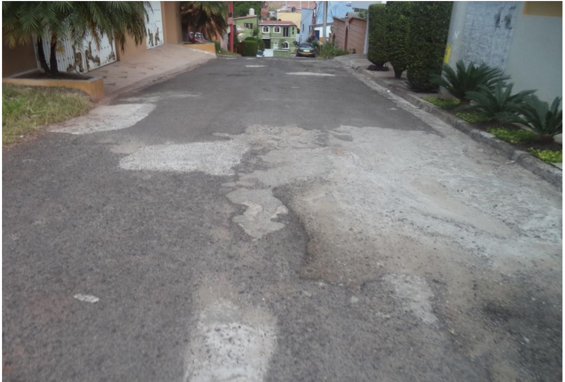
Vista panorámica de una de las calles a intervenir en la colonia Miramontes