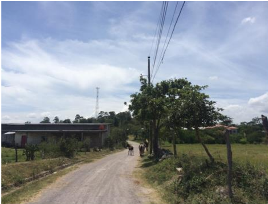
VISTA PANORÁMICA DE CALLE A REPARAR