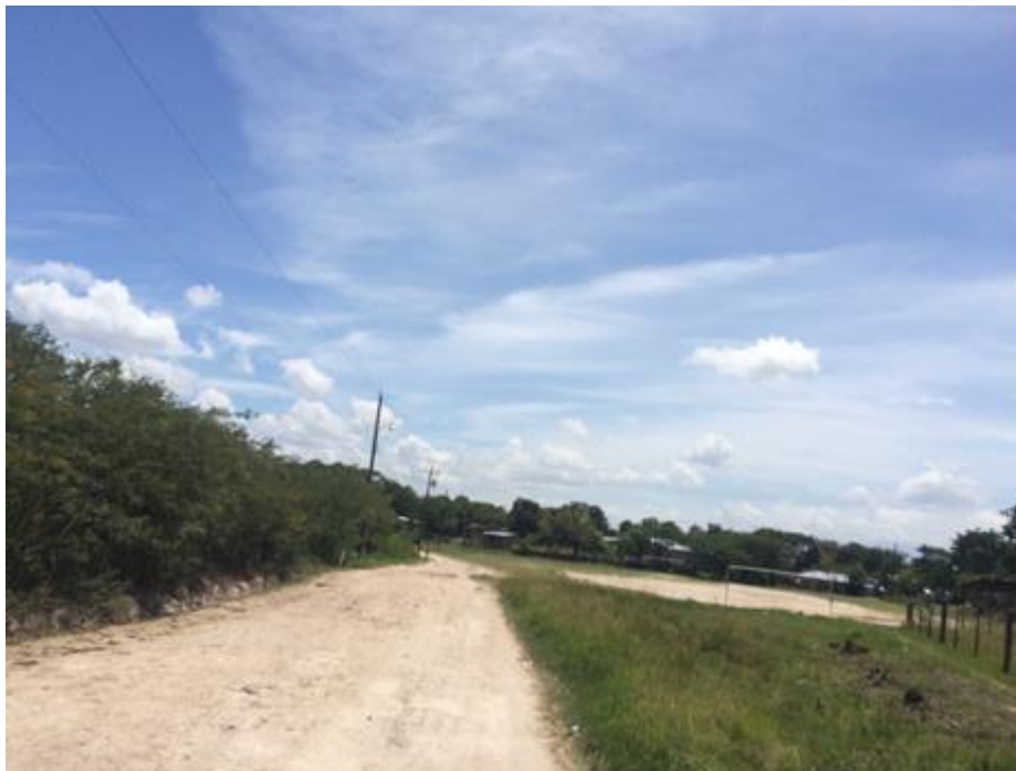
VISTA DE LA CALLE A BALASTAR