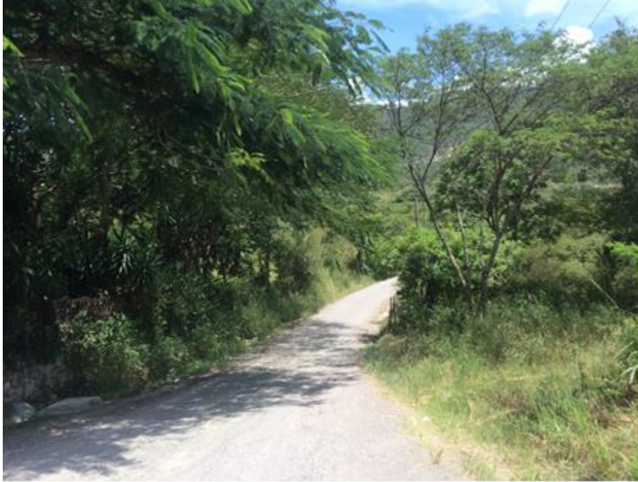
INICIO DE CALLE A REPARAR