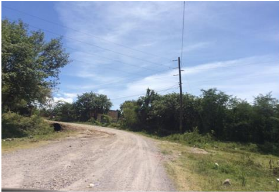
VISTA ACTUAL DE CALLE A REPARAR