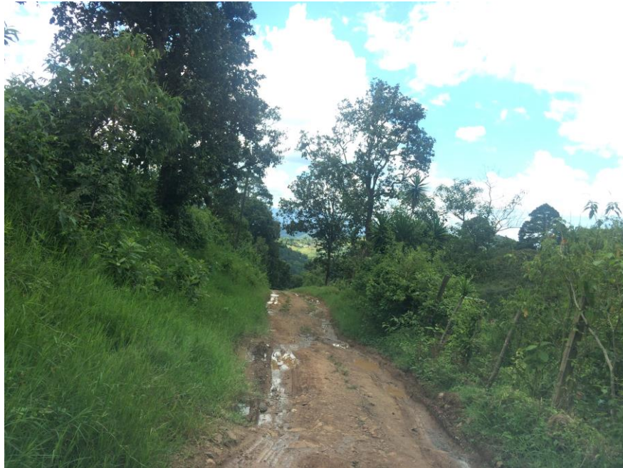
VISTA DE CALLE A REPARAR