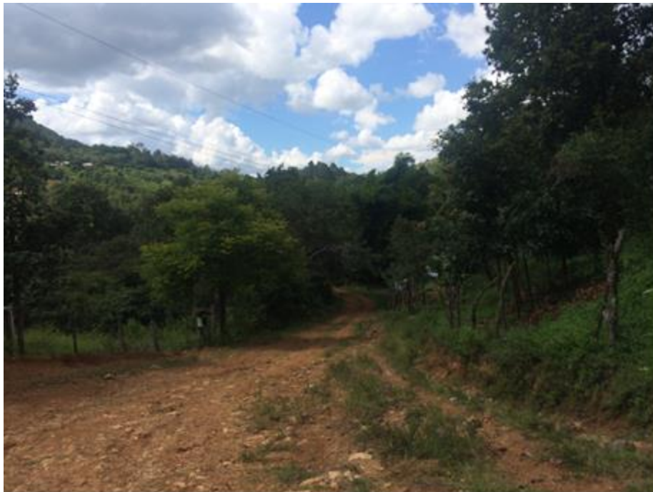
CALLE REQUIERE MECANIZADO Y BALASTADO