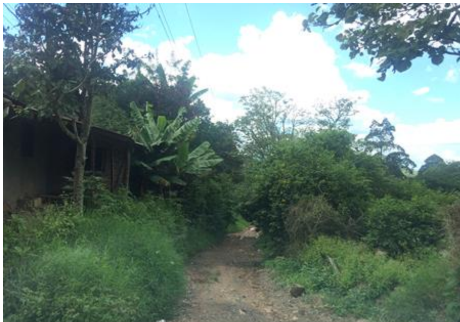
VISTA ACTUAL DE CALLE A REPARAR