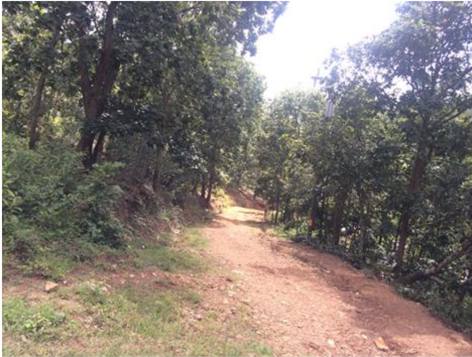
VISTA PANORÁMICA DE CALLE A MECANIZAR