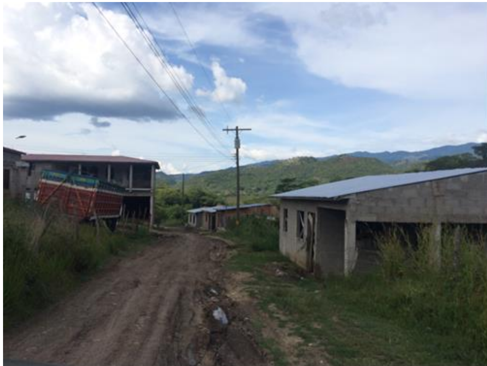
Vista de calle que requiere balastado