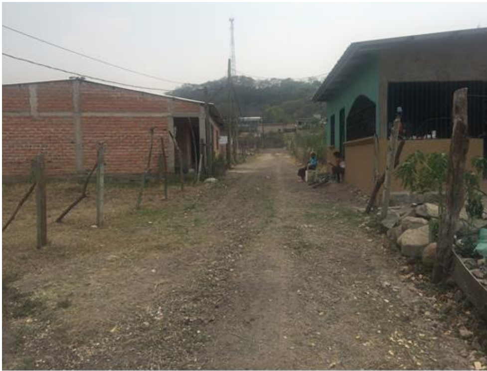
Vista panorámica de calle a reparar

Proyecto: Conformación y balastado de calles, col. Villa Madrid y Rio Abajo Código: 1443