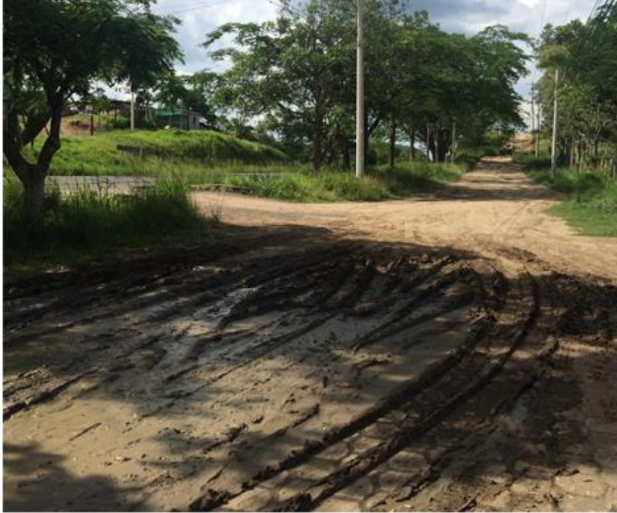
Inicio de calle a reparar