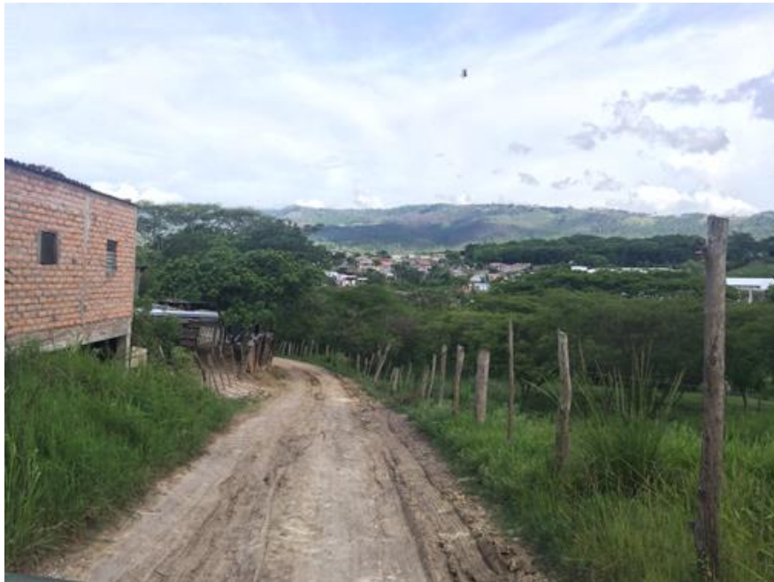
Vista actual de calle a reparar