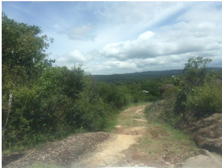
VISTA DEL ESTADO DE LA CALLE