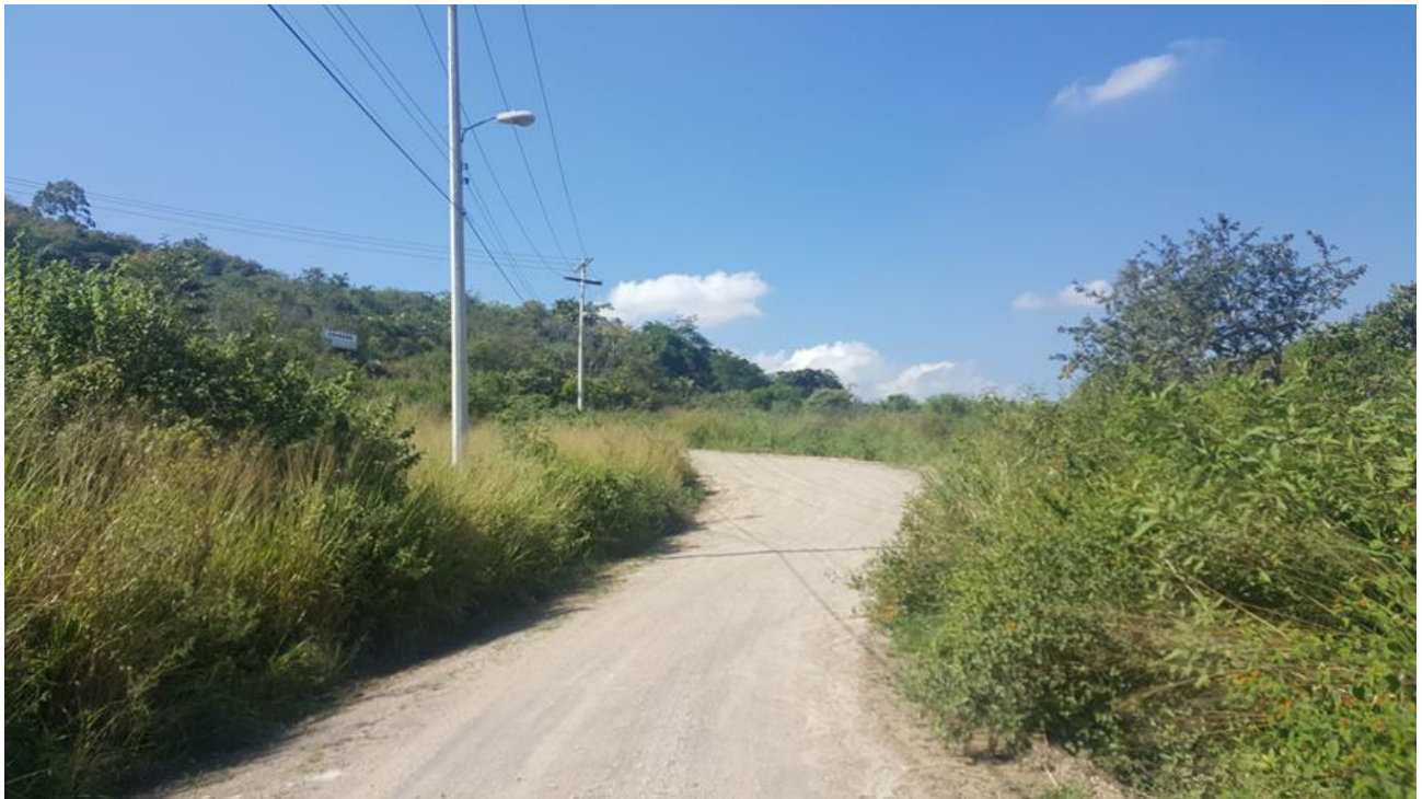
Vista panorámica del estado de la calle