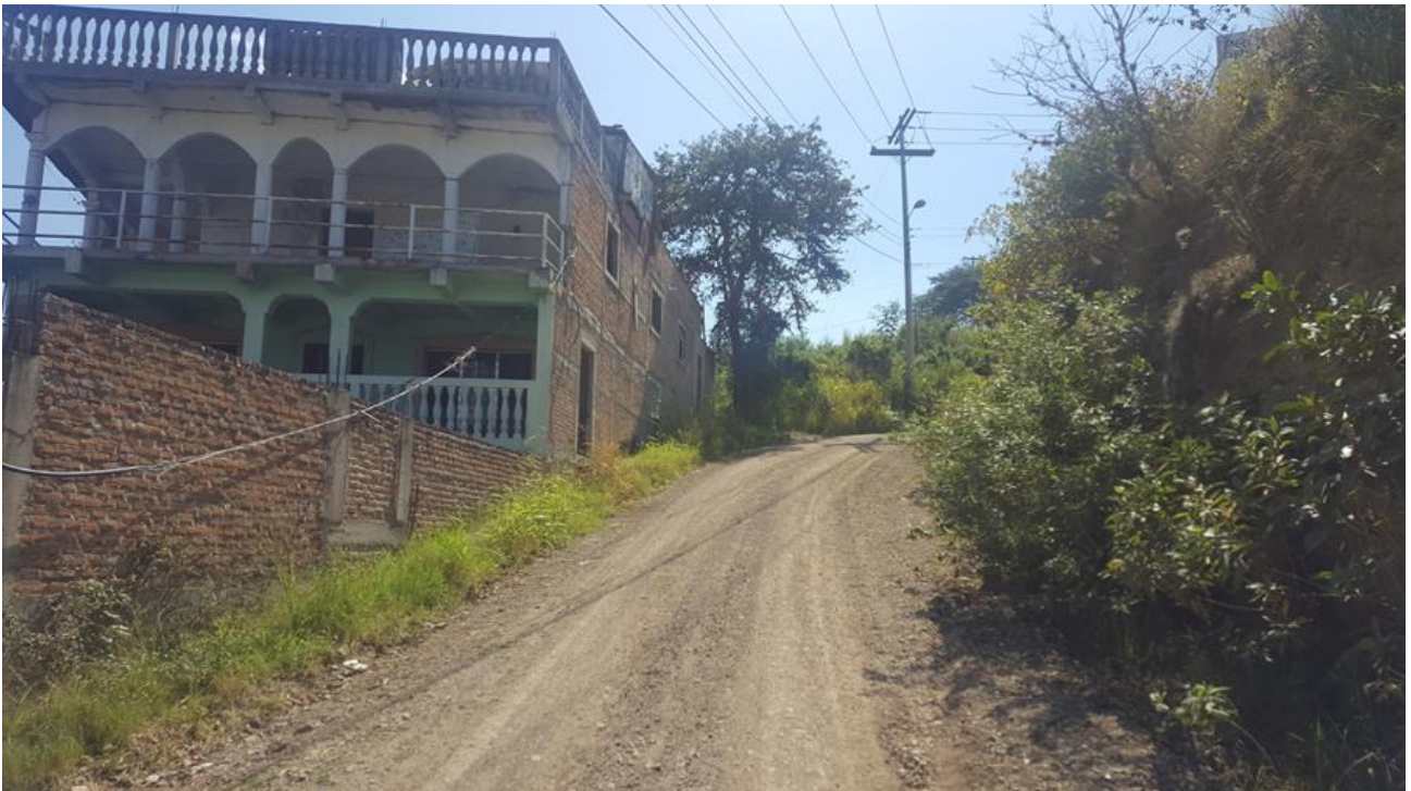
Vista de calle a pavimentar