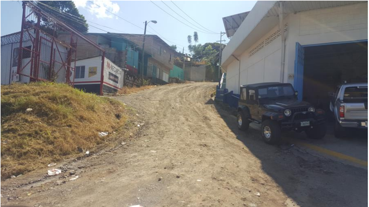
Inicio de construcción de huellas vehiculares