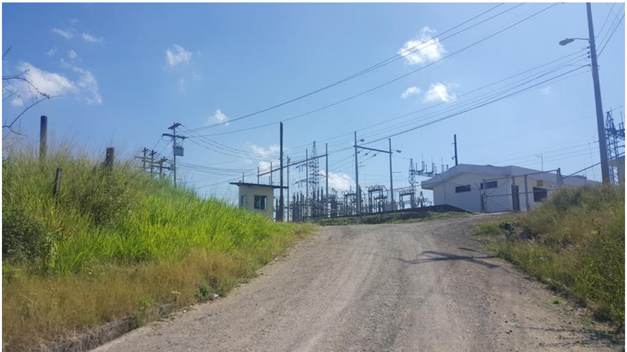
Final de huellas vehiculares