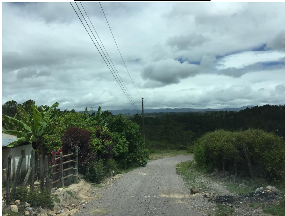
VISTA ACTUAL DE CALLE A REPARAR