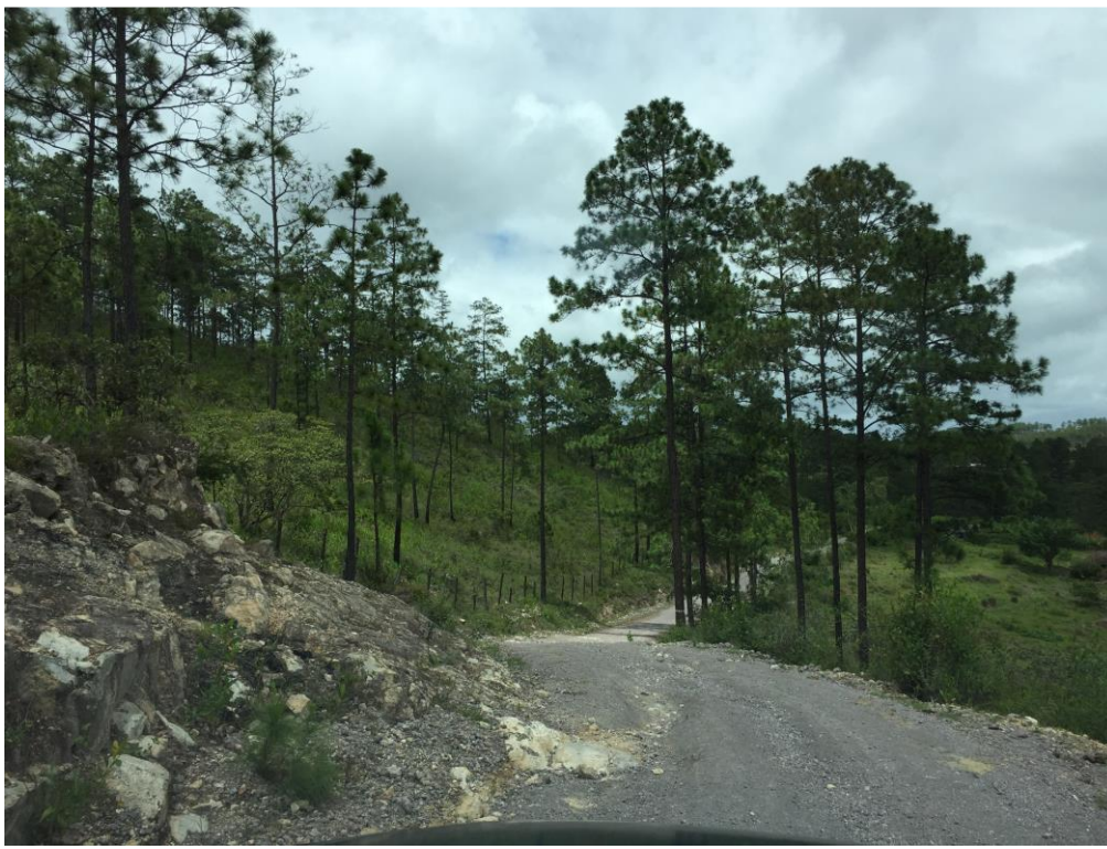
INICIO DE CALLE A REPARAR