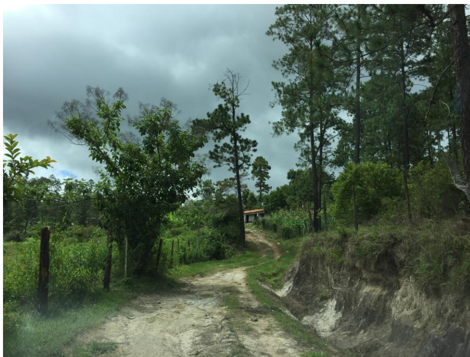
FINAL DE CALLE QUE REQUIERE MECANIZADO Y BALASTADO