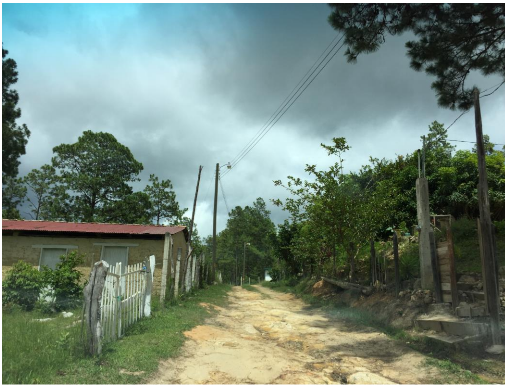
VISTA PANORÁMICA DE CALLE A MECANIZAR