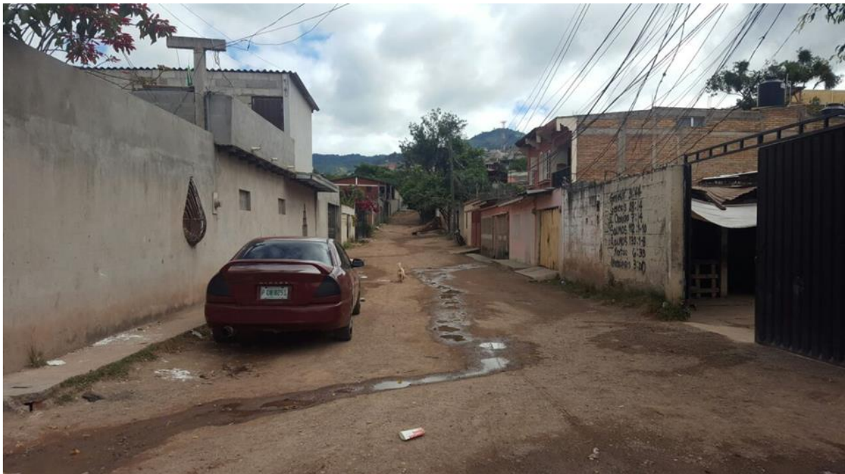
PANORAMA DE CALLE A PAVIMENTAR CON CONCRETO HIDRAULICO