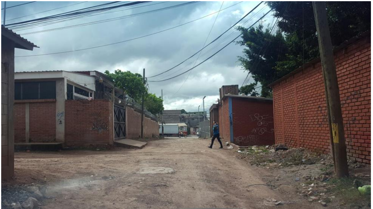
VISTA DE CALLE A PAVIMENTAR