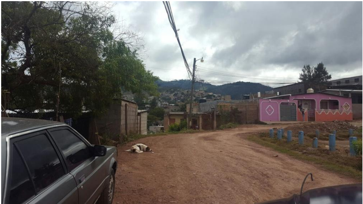
VISTA DE CALLE A PAVIMENTAR CON CONCRETO HIDRAULICO