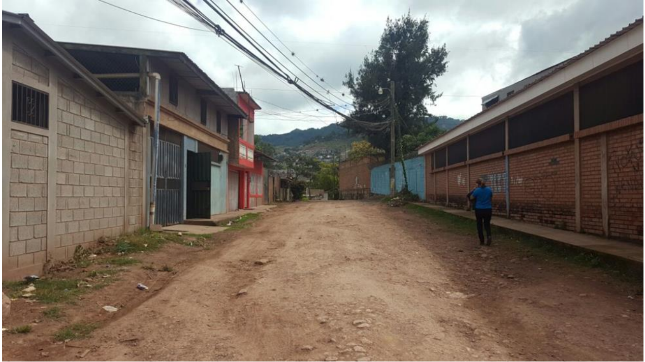
PANORAMA DE CALLE A PAVIMENTAR CON CONCRETO HIDRAULICO