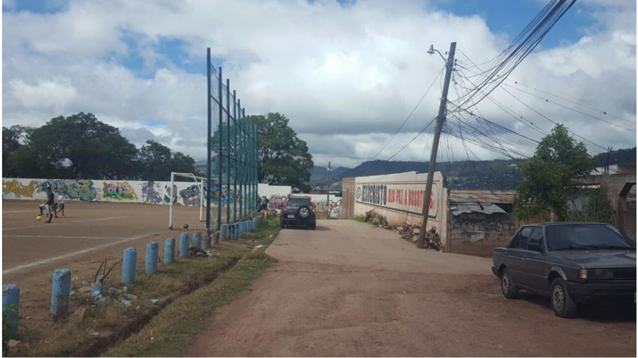
CALLE A PAVIMNTAR CON CONCRETO HIDRAULICO