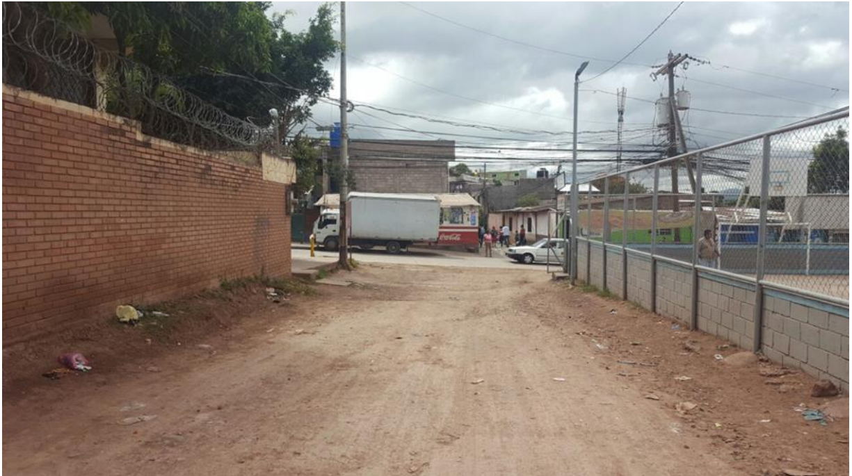
VISTA DE CALLE A PAVIMENTAR