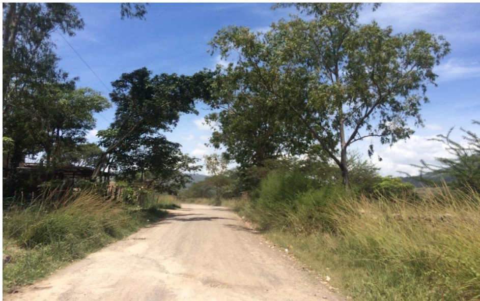
VISTA ACTUAL DE CALLE A REPARAR