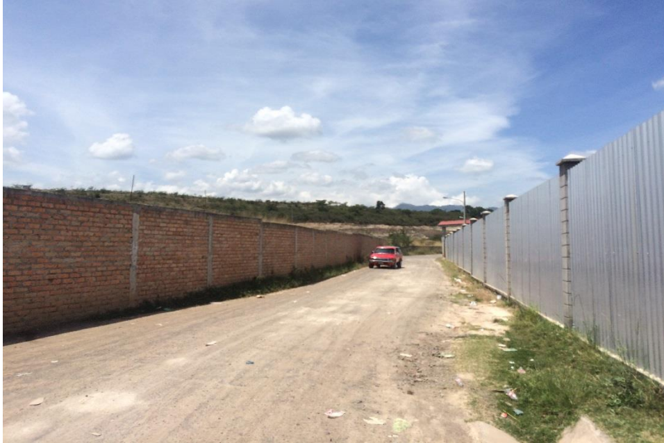
INICIO DE CALLE A REPARAR