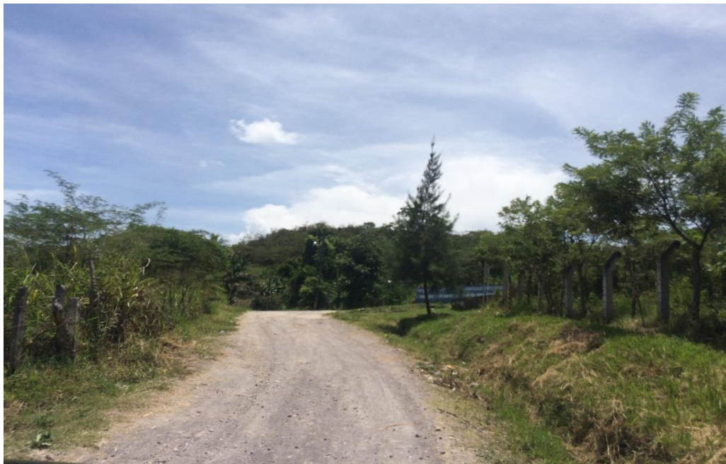
VISTA DE LA CALLE A BALASTAR