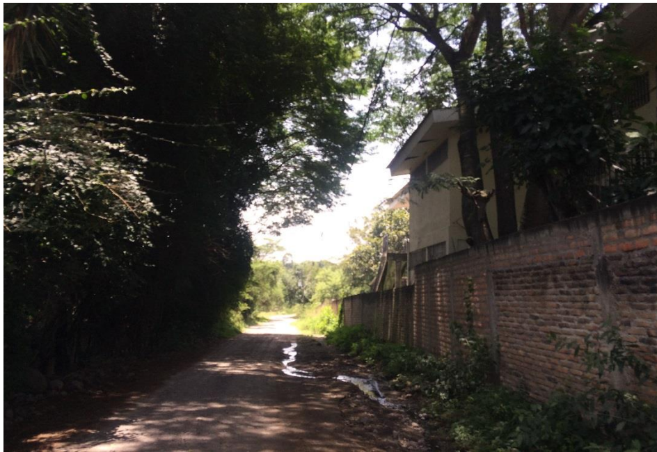
VISTA DE CALLE A REPARAR