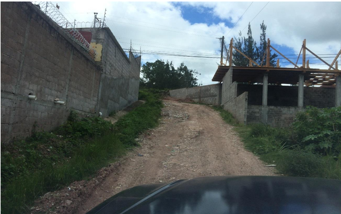
CALLE REQUIERE MECANIZADO Y BALASTADO