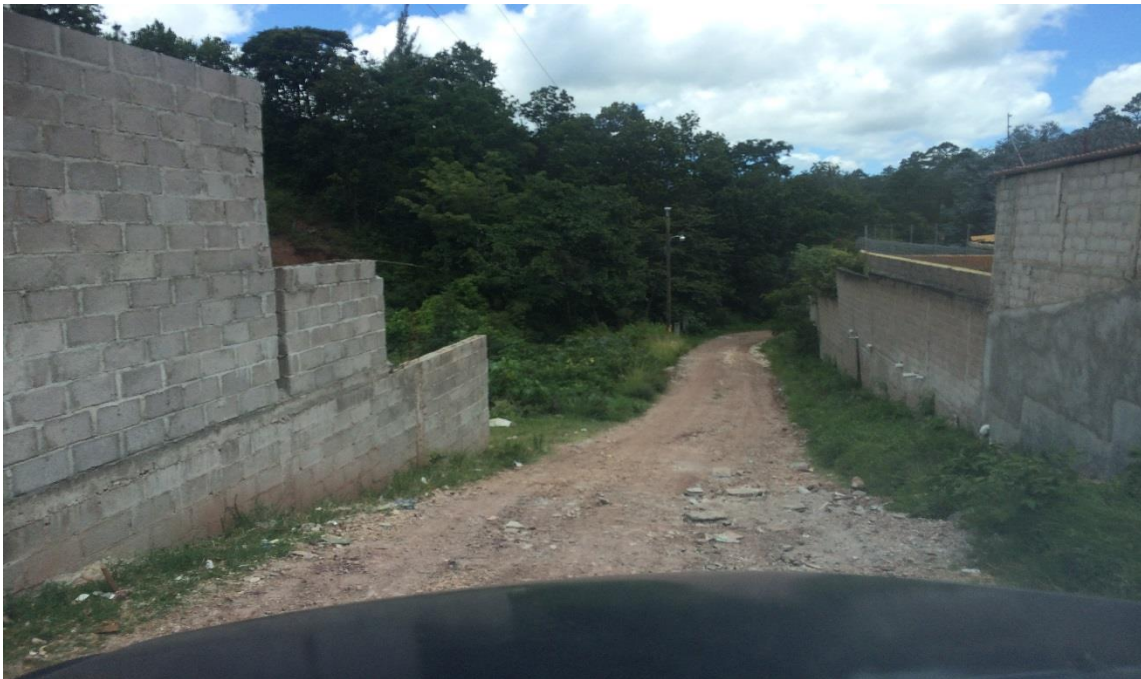
VISTA PANORÁMICA DE CALLE A MECANIZAR