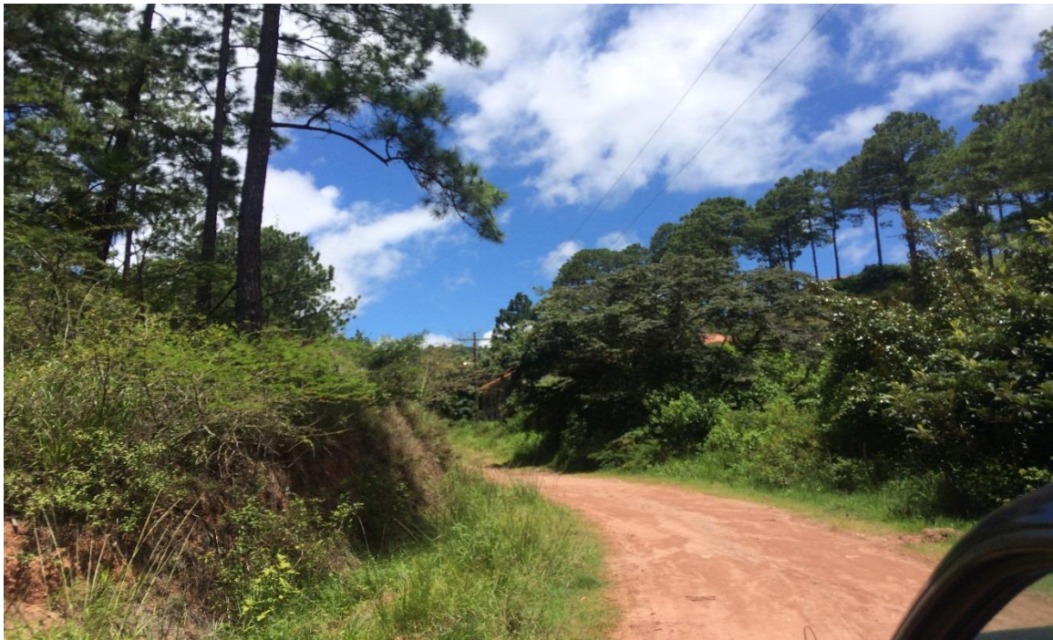
VISTA ACTUAL DE CALLE A REPARAR