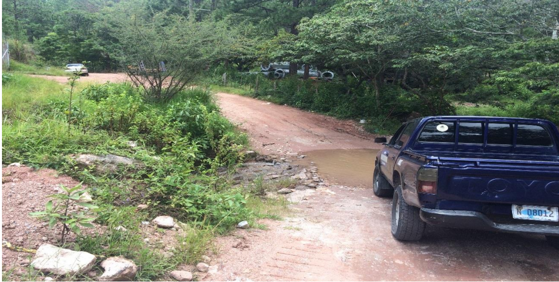
INICIO DE CALLE A REPARAR