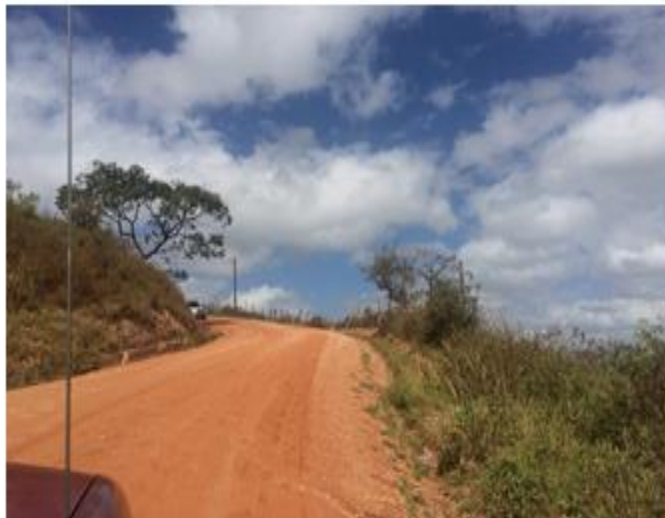
Curva en mal estado