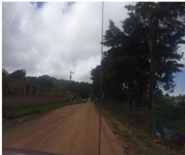
Vista de Calle a reparar