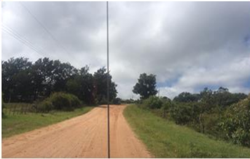
Calles de Tierra