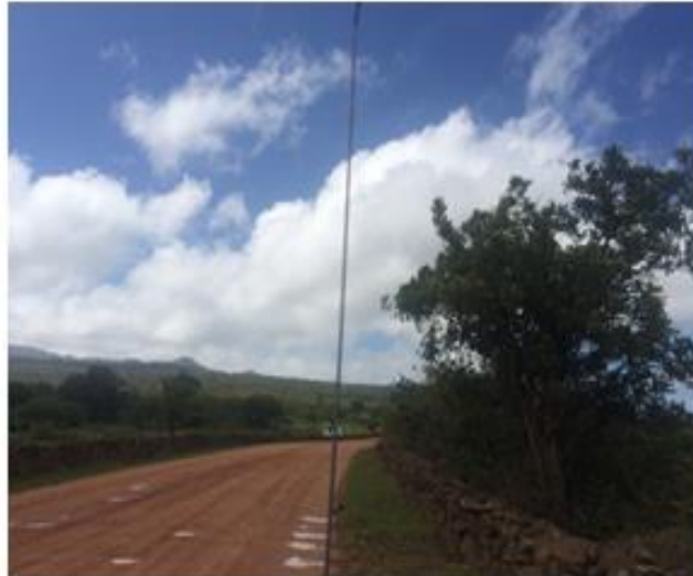
Calle a reparar