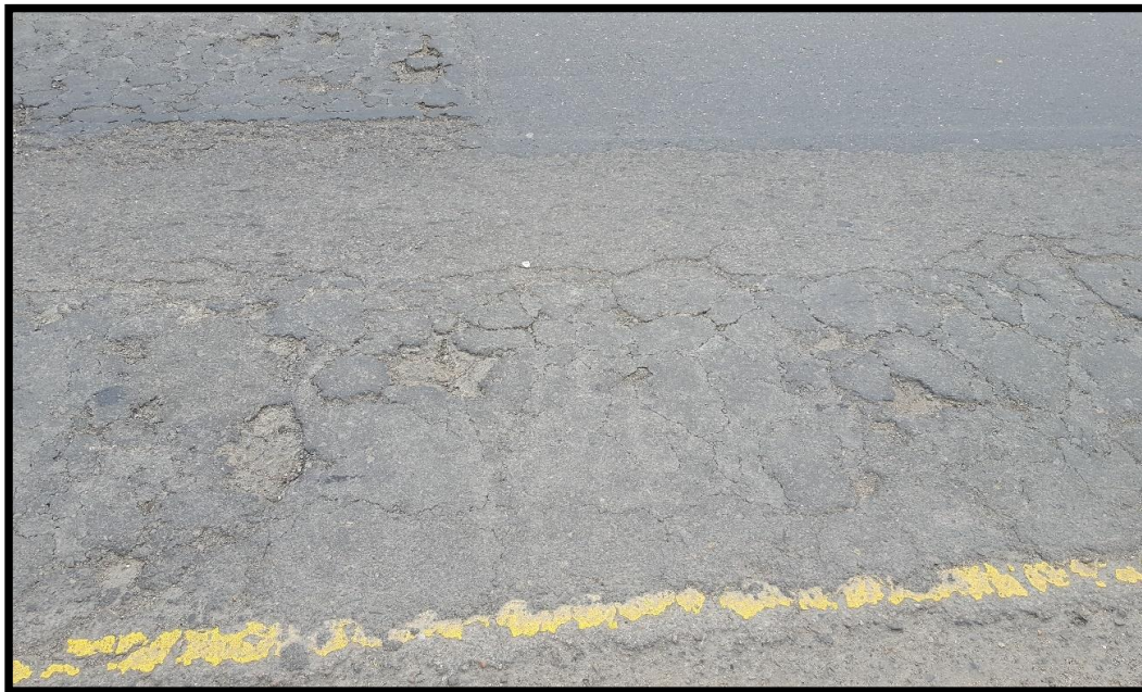
VISTA DEL TRAMO A TRABAJAR CON MEZCLA ASFÁLTICA