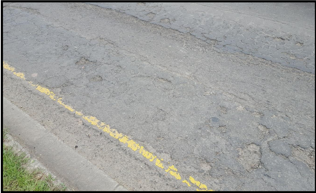
VISTA DEL TRAMO EN MAL ESTADO DE LAS CALLES