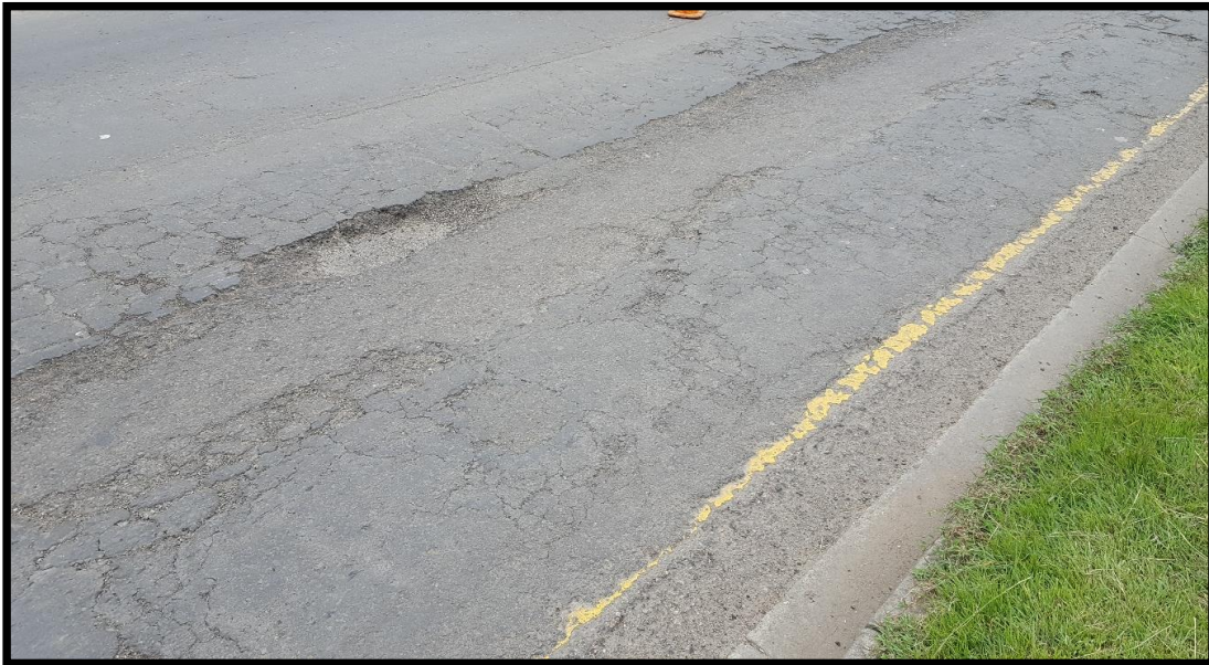
VISTA DEL DETERIORO DE LA CALLE