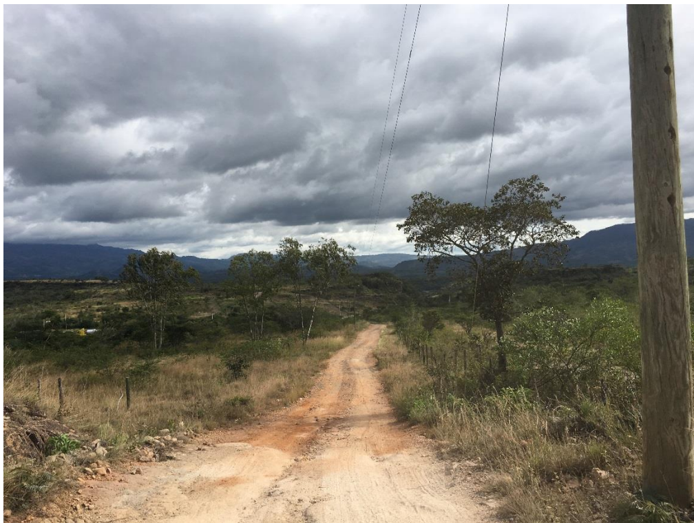
VISTA ACTUAL DE CALLE A REPARAR