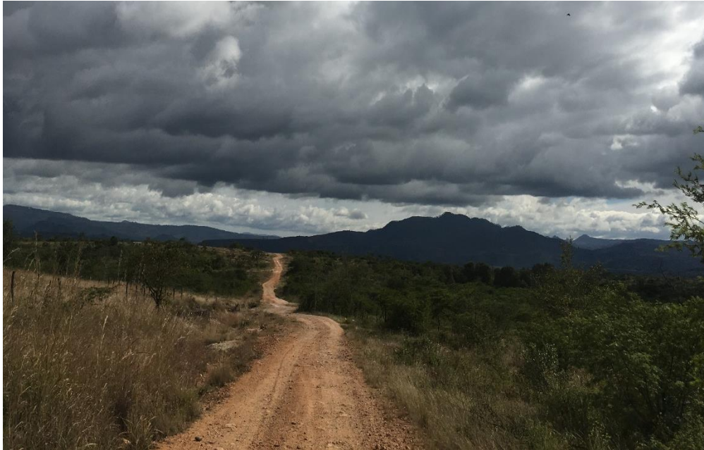
VISTA PANORÁMICA DE CALLE A REPARAR