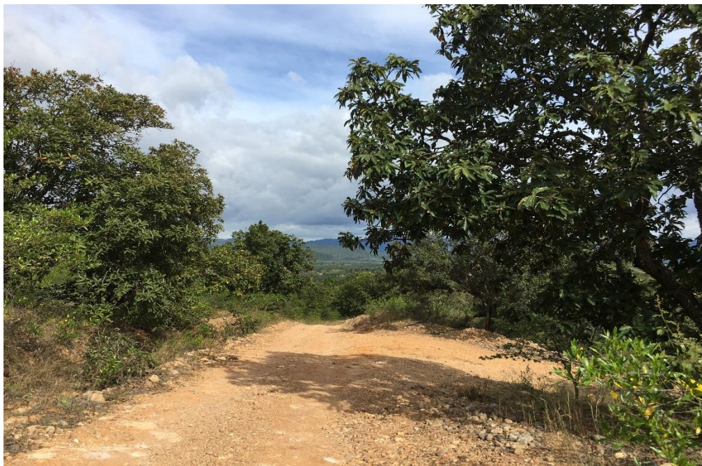
VISTA DE CALLE QUE REQUIERE BALASTADO