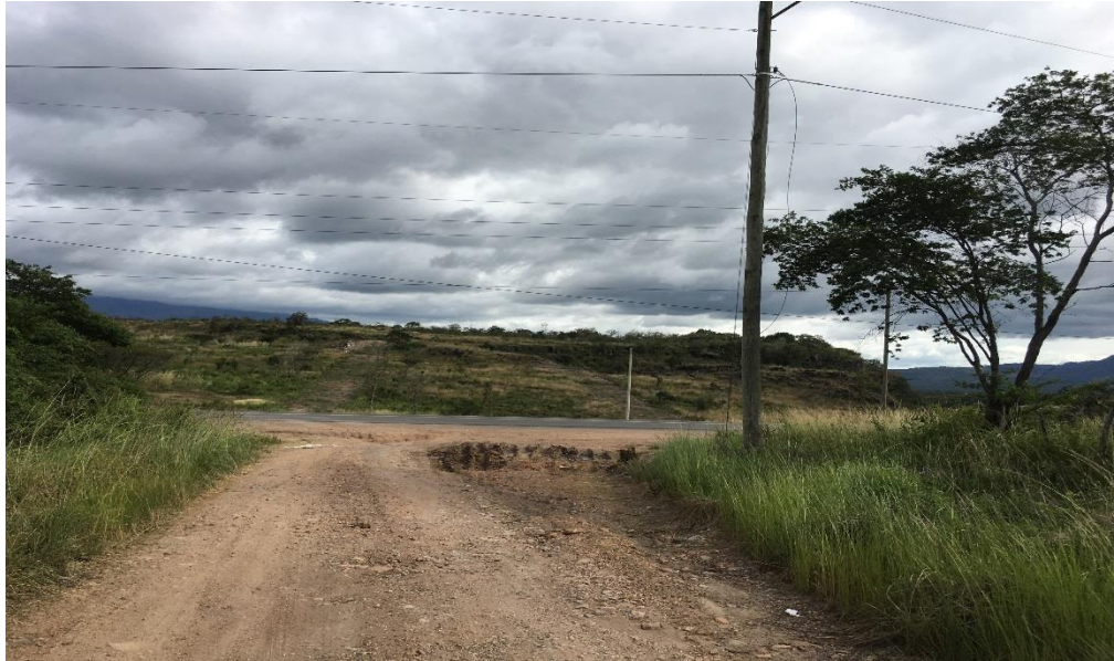
VISTA DE CALLE A REPARAR