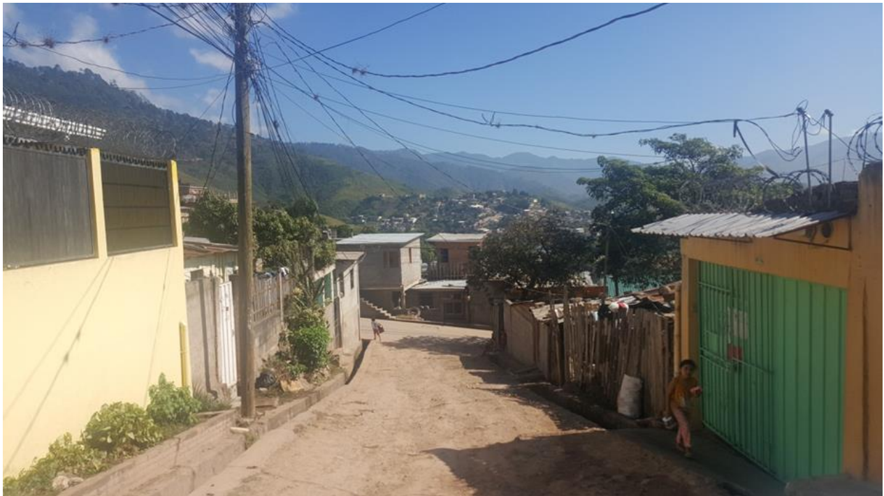
Inicio de calle a pavimentar