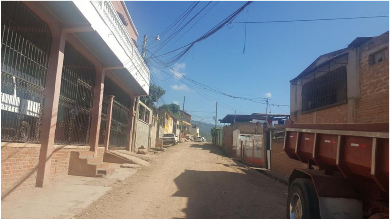
Vista del estado de calle a pavimentar