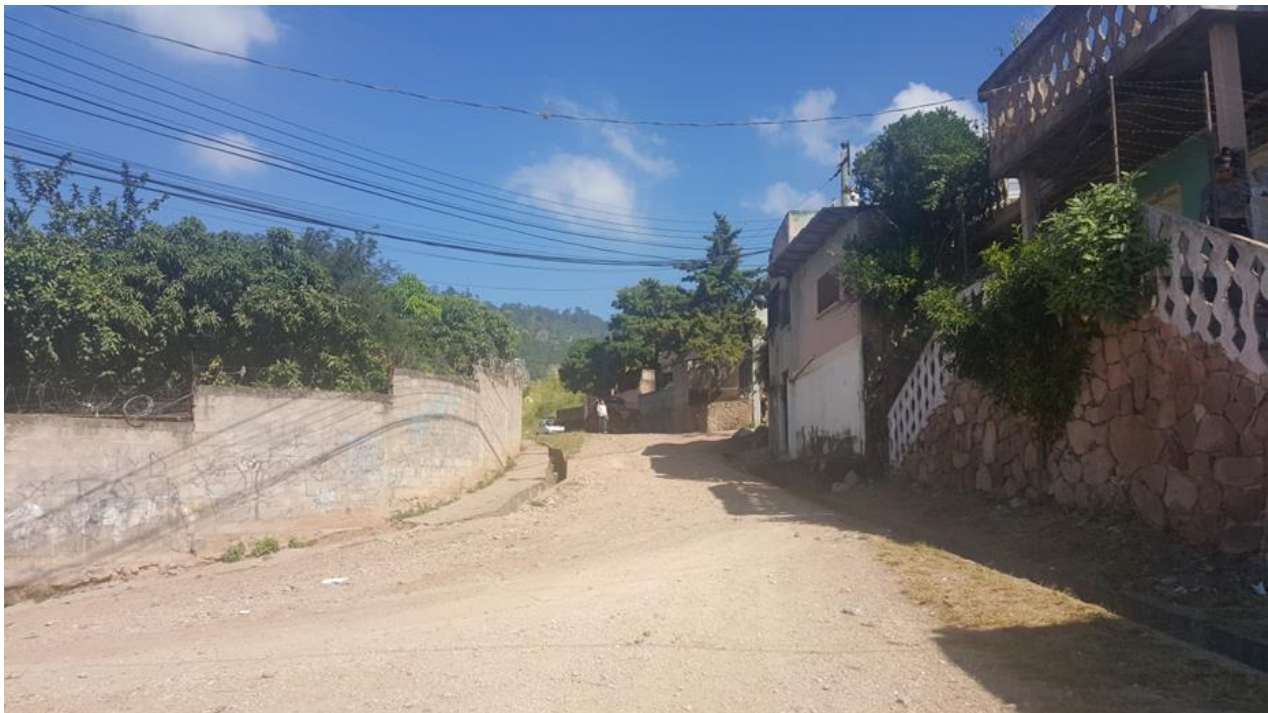
Final de calle a pavimentar