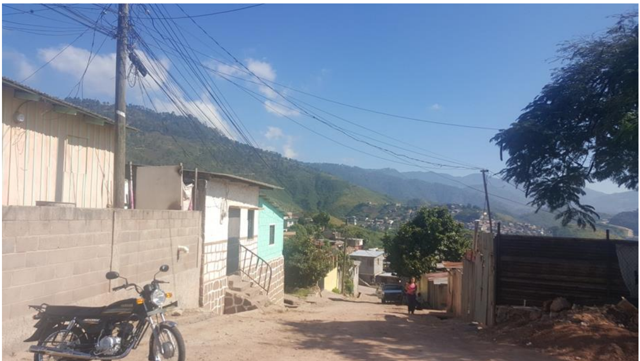
Panorama de calle a pavimentar